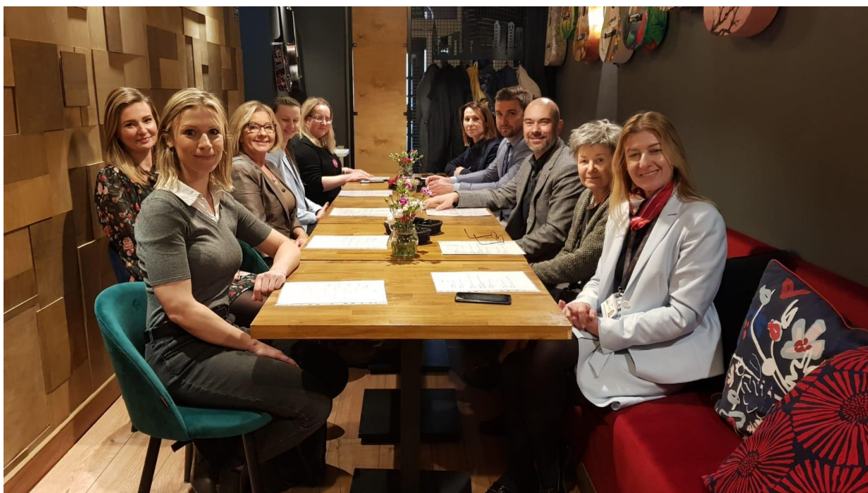
fot.19 – Spotkanie uczelnianych koordynatorów ds. współpracy z zagranicą w ramach ZWPUZ