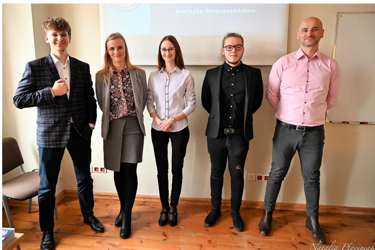
fot. 45–Wykład pt.: „Wykrywanie nadużyć finansowych.”, Dzień Otwarty w ANS Gniezno, dn. 8 kwietnia 2022 r.