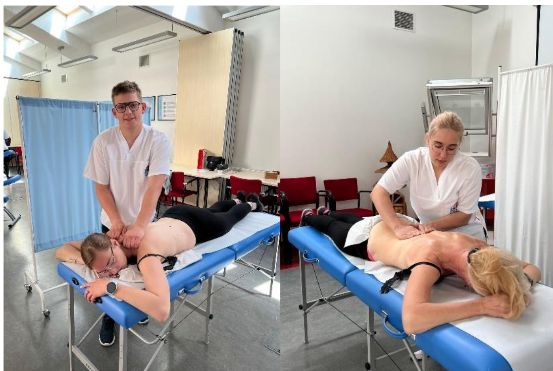
fot. 48– Studenci fizjoterapii wsparli Dzień Zdrowia Fizycznego w firmie VELUX, w dn. 12 maja 2022 r.

12 maja br.firma VELUX zorganizowała w swoim zakładzie Dzień Zdrowia Fizycznego i zaprosiła do współpracy wykładowców i studentów fizjoterapii w ANS Gniezno.W ramach tego przedsięwzięcia studenci III i IV roku fizjoterapii wykonywali pracownikom firmy masaże, poprowadzili gimnastykę ogólnousprawniającą, mierzyli grubość tkanki tłuszczowej oraz badali parametry życiowe. Dla naszych studentów była to doskonała okazja, by wykazać się umiejętnościami, jakie zdobyli podczas zajęć w ANS Gniezno.