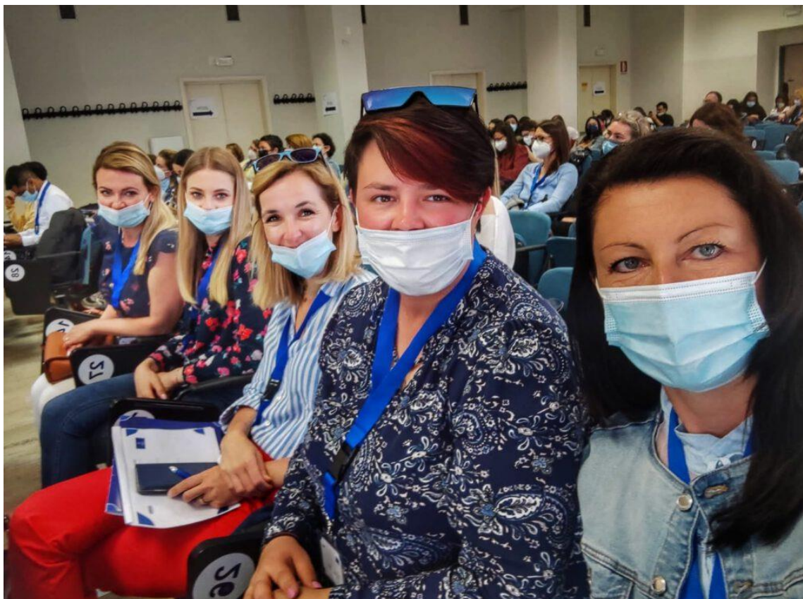
fol. 26 – Międzynarodowe szkolenie - International Staff Week w Neapolu, w dn. 4-6 maja 2022 r.

Międzynarodowe szkolenie był wyjątkową okazją do zwiększenia kompetencji językowych, poznania kultury Włoch, zasmakowania specjałów włoskiej kuchni i odkrycia wielu, fantastycznych miejsc oraz sposobów na tanie podróżowanie po Europie.