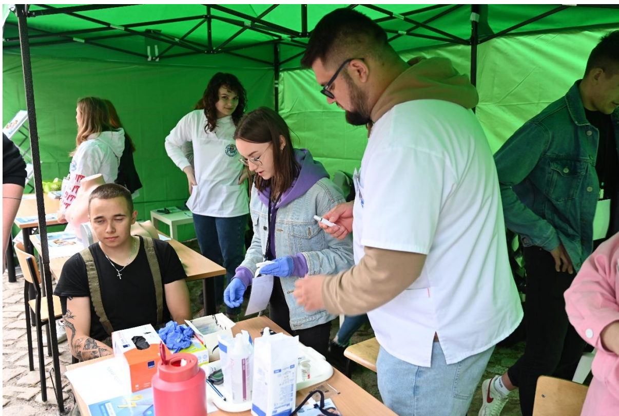
fol. 49–Studencki punkt medyczny, Gnieźnieński Piknik Akademicki w ANS Gniezno, dn. 27 maja 2022 r.