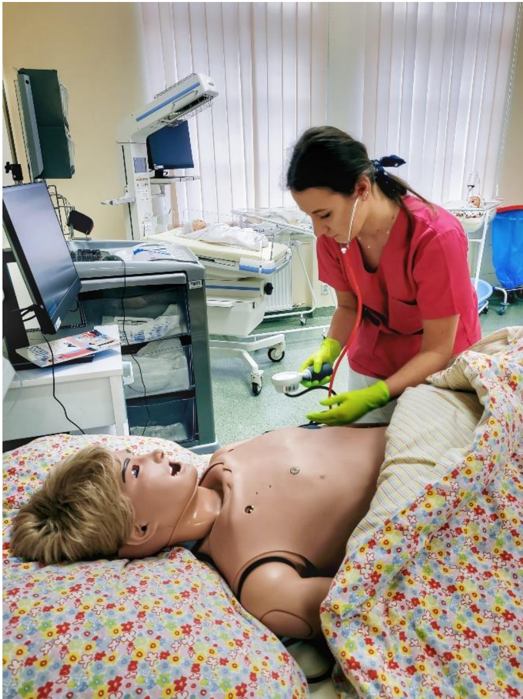
foto.5 - Szkolenia z zakresu symulacji medycznych pośredniej i wysokiej wierności, w dn. 6-9 grudnia 2021 r.