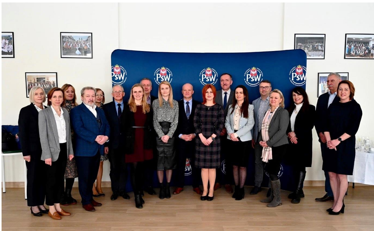
fot. 31 – Spotkanie władz akademickich ANS Gniezno z dyrektorami szkół średnich z Gniezna, powiatu gnieźnieńskiego oraz powiatów ościennych