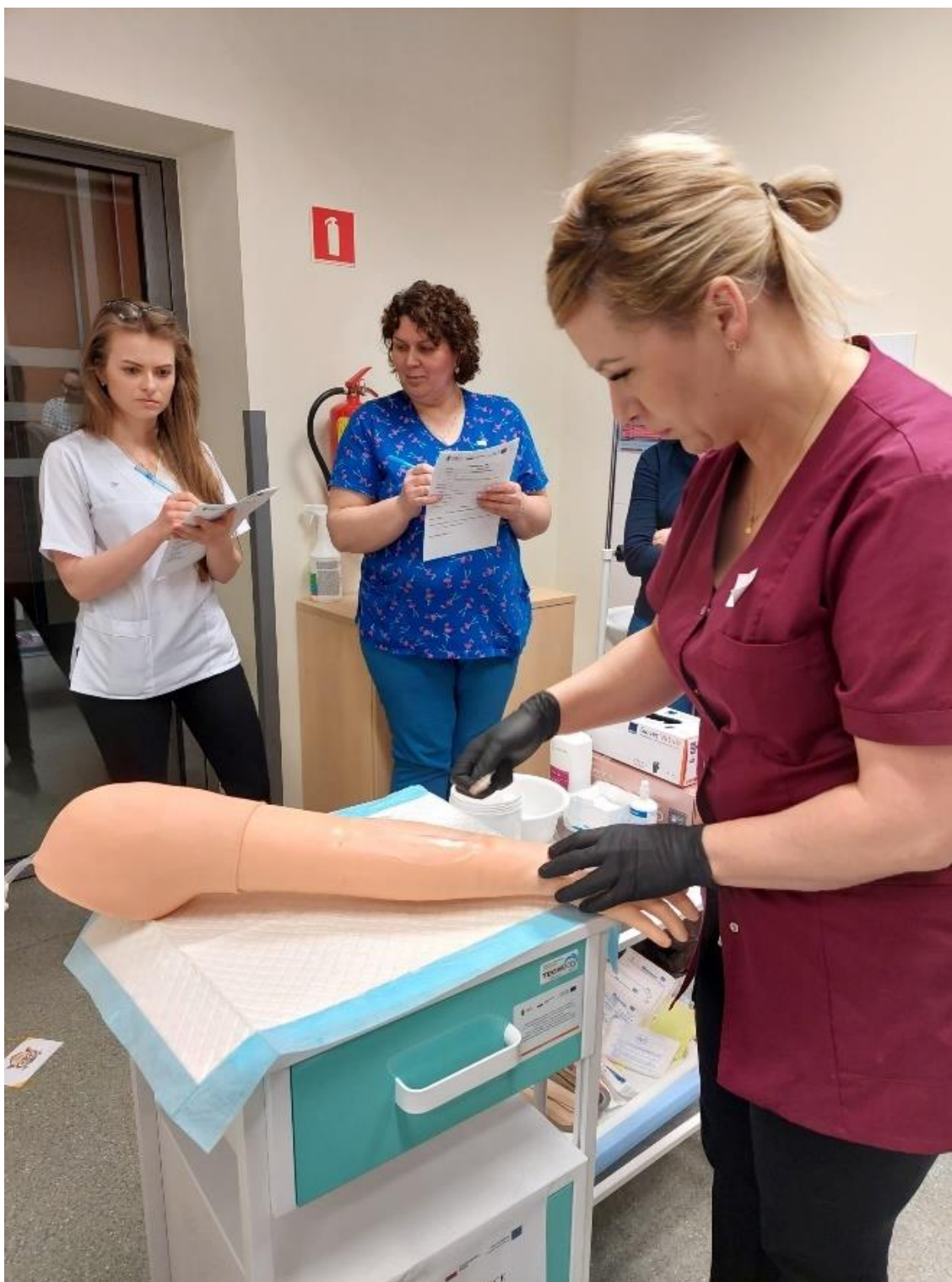
foto.8 - Szkolenie z zakresu symulacji niskiej wierności, w dn. 28-31 marca br.