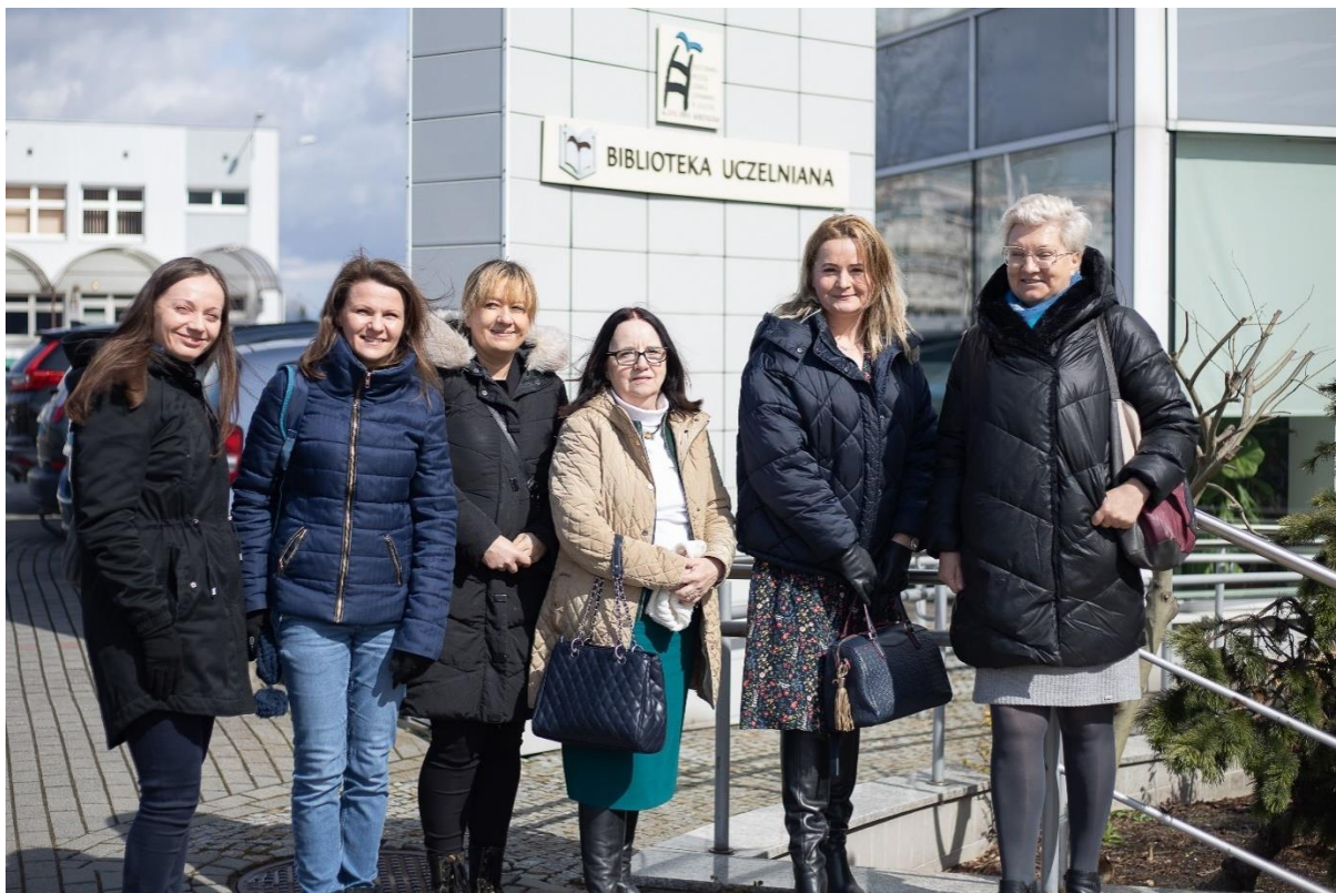
fol. 57 – Spotkanie bibliotekarzy w ramach Związku Wielkopolskich Publicznych Uczelni Zawodowych

Ponadto wzięli również udział w Tygodniu Bibliotek. Wydarzenie, które co roku organizuje Stowarzyszenie Bibliotekarzy Polskich, ma na celu promocję czytelnictwa. Tegoroczna edycja odbyła się na gnieźnieńskim rynku i była okazją do wypromowania nie tylko biblioteki, ale również zaprezentowania oferty edukacyjnej naszej Uczelni.