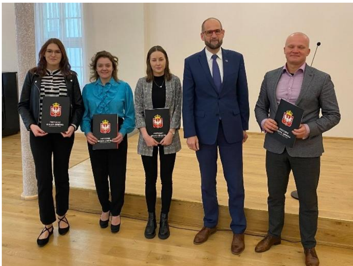
fot.12- Rozdanie stypendiów Miasta Gniezna, dn. 5 listopada 2021 r.