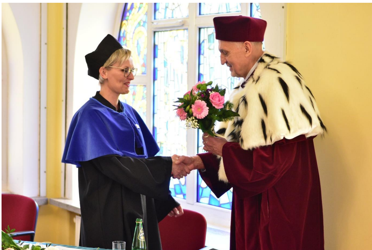
fot.1 - Uroczystość Czepkowania studentów pielęgniarstwa w dn. 13 maja 2022 r.