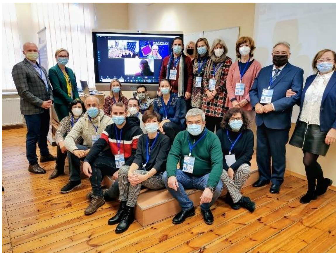
fot.6-Spotkanie międzynarodowego zespołu InovSafeCare, w dn. 7-10 grudnia 2021 r.

W trakcie w/w warsztatów zostały zaprezentowane efekty pracy poszczególnych partnerów naukowych, w zakresie opracowania innowacyjnych metod prewencji i kontroli zakażeń szpitalnych. Zaprezentowano również: pedagogiczny model ISC, wyniki badań jakościowych w oparciu o przeprowadzone w krajach partnerskich grupy fokusowe i wywiady, wyniki badań ilościowych zrealizowane na podstawie kwestionariuszy adresowanych do studentów, scenariusze symulacji, eBook/MOOC oraz prototypy innowacyjnych narzędzi wspomagających prewencję i kontrolę zakażeń szpitalnych.