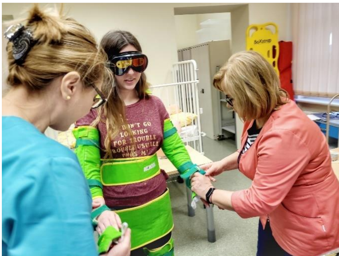
fot. 42–Pokaz umiejętności pielęgnarskich przy wykorzystaniu trenerów i fantomów, Dzień Otwarty w ANS Gniezno, dn. 8 kwietnia 2022 r.