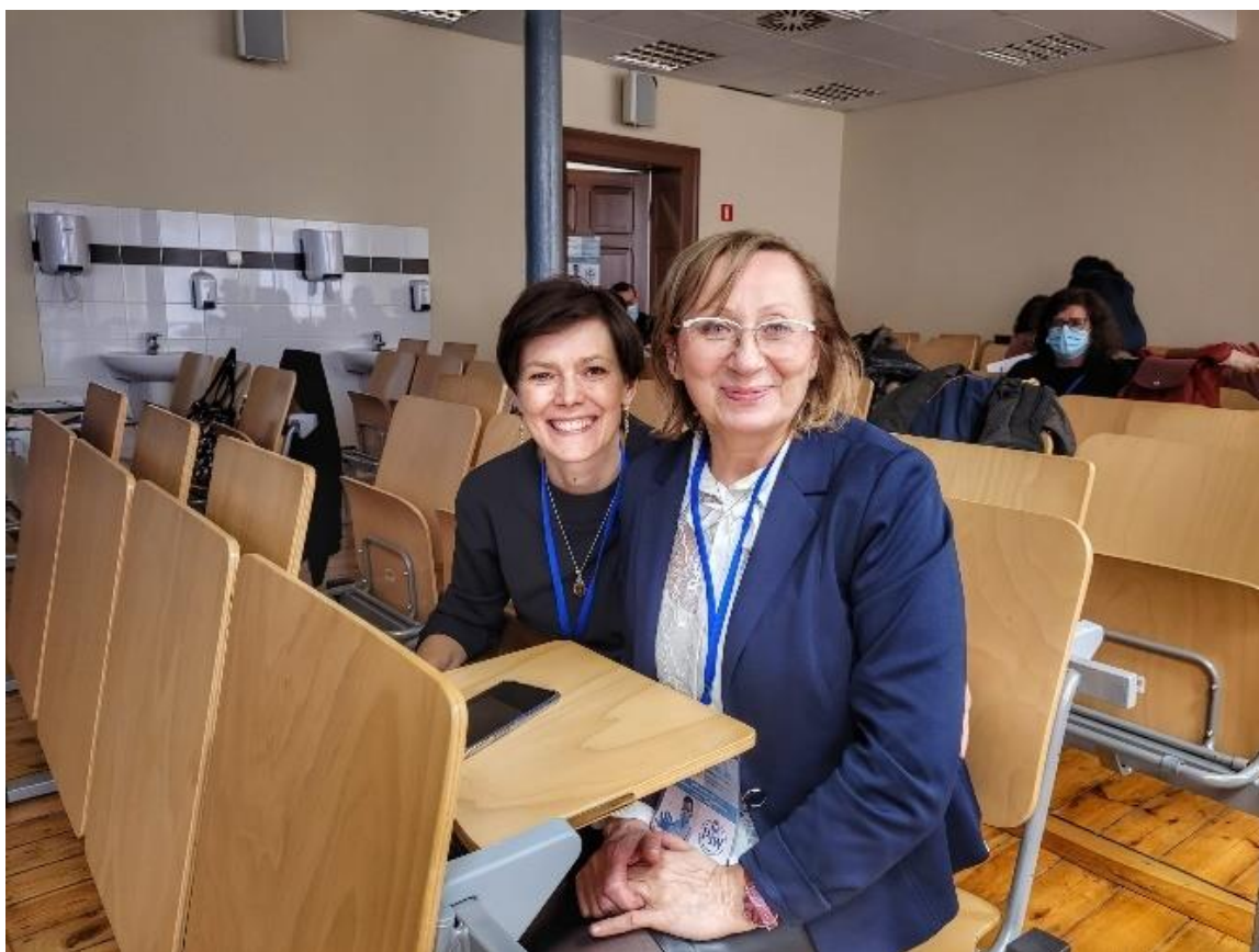
fot.7-Spotkanie międzynarodowego zespołu InovSafeCare, w dn. 7-10 grudnia 2021 r.