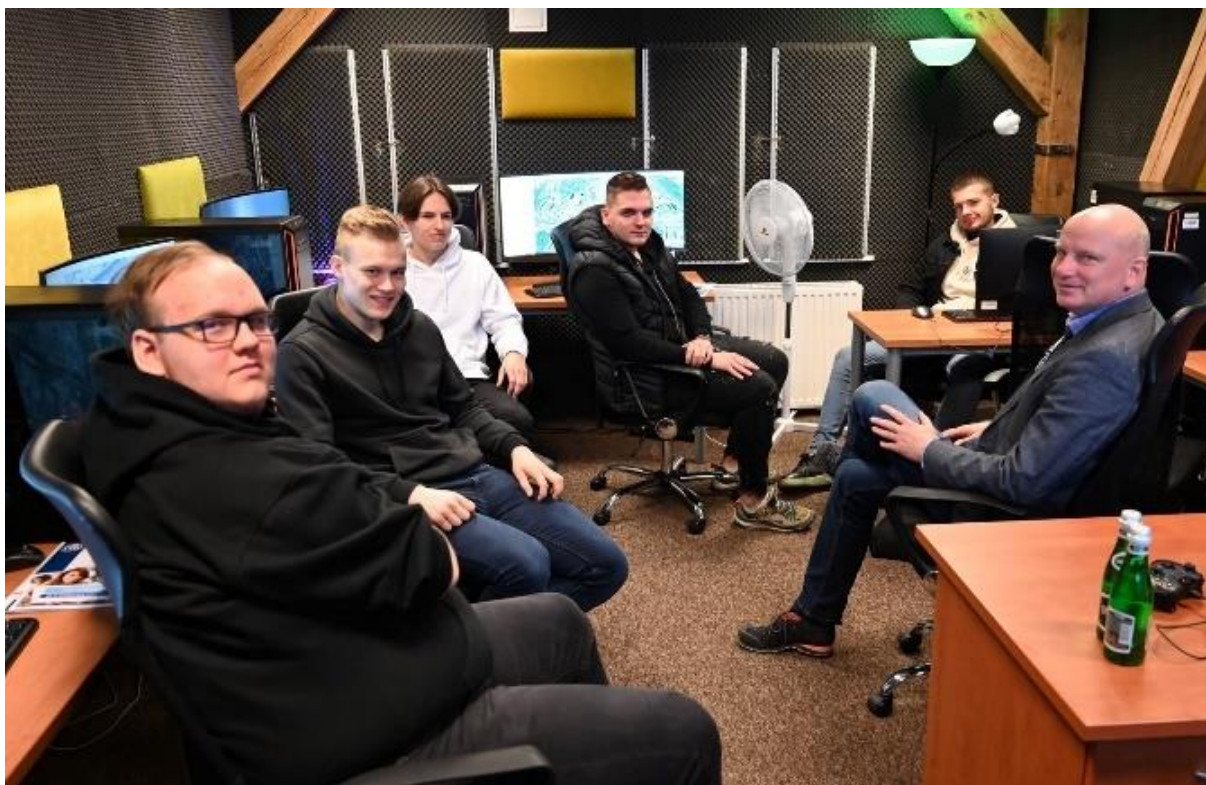
fot. 44–Warsztaty z tworzenia systemów informacji geograficznej. Dzień Otwarty w ANS Gniezno, dn. 8 kwietnia 2022 r.