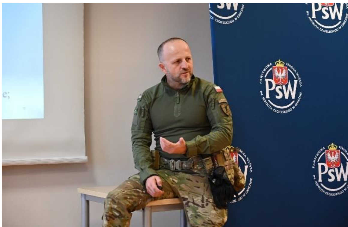
fot. 40-NAVAL - prelekcja pt.: „Afganistan wczoraj i dziś”; Dzień Otwarty na analityce bezpieczeństwa, dn. 19 listopada 2021 r.