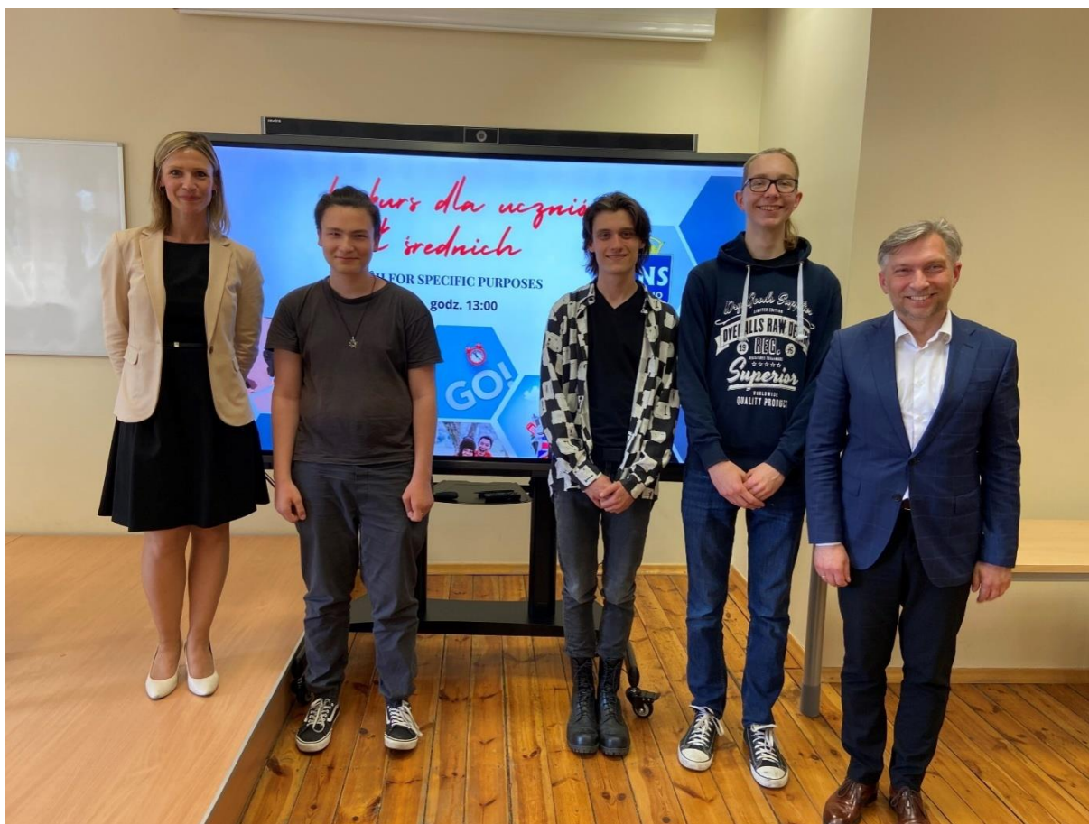
fot. 20 – Laureaci konkursu English for Specific Purposes, z dn. 19 maja 2022 r.