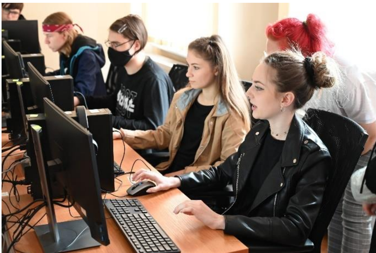
fot. 50 – Warsztat z tworzenia animacji w programie FireAlpaca, Gnieźnieński Piknik Akademicki w ANS Gniezno, dn. 27 maja 2022 r.