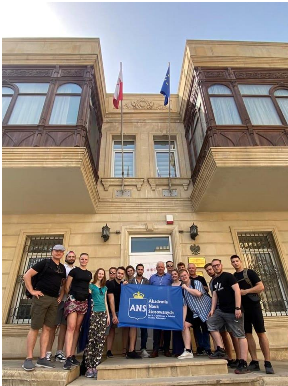
fot.17 – Studenci analityki bezpieczeństwa przed Ambasadą RP w Baku w Azerbejdżanie, w dn. 13 czerwca 2022 r.

politycznej, gospodarczej, społecznej i turystycznej kraju. Zgromadzone materiały zostały przez studentów przeanalizowane, dzięki czemu powstał interesujący materiał, który zostanie przedstawiony w formie raportu oraz opublikowany na stronie Instytutu Nauk o Bezpieczeństwie – www.analitik.pl .