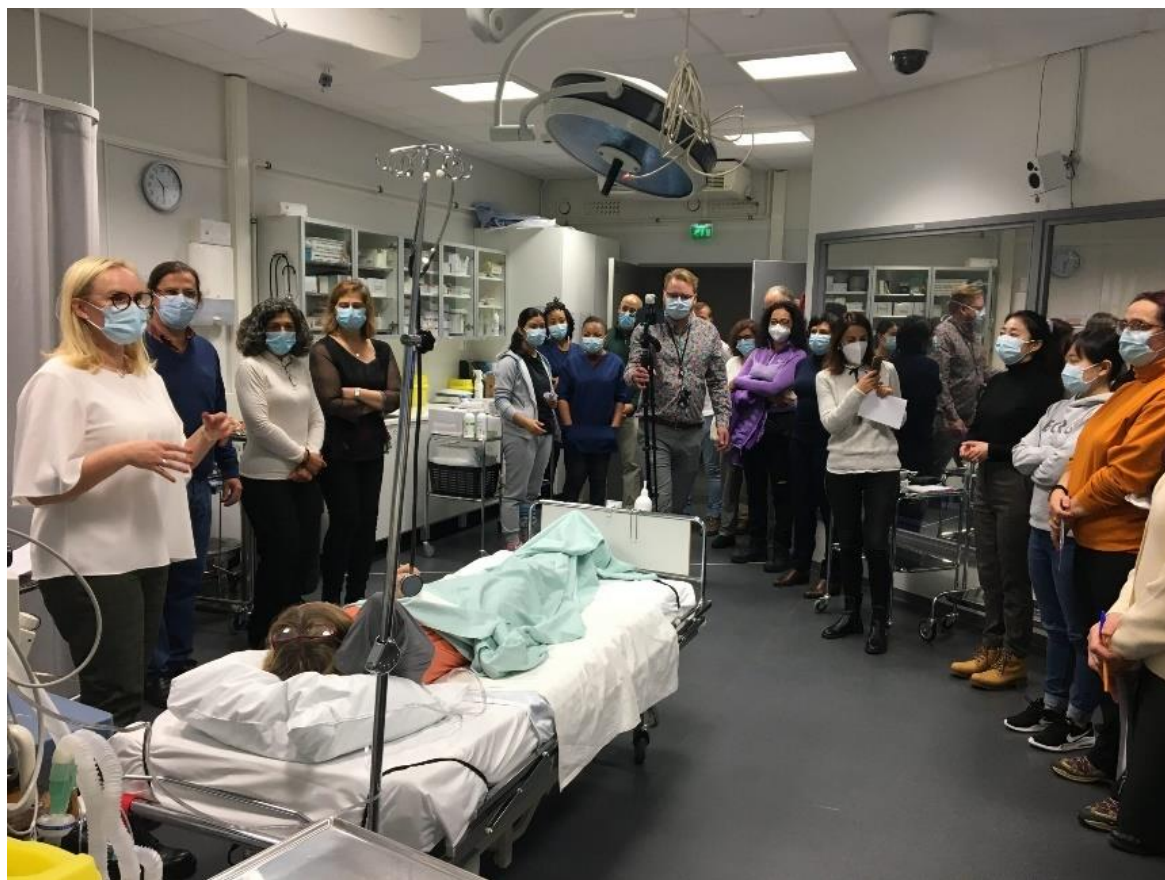
fot. 28 – Wykładowcy ANS Gniezno na spotkaniu zespołu InovSafeCare w Kuopio w Finlandii, w dn. 25-28 października 2021 r.

związanych z projektem InovSafeCare, które odbyły się w Kuopio w Finlandii. Członkowie międzynarodowego Konsorcjum ISC wymieniali się dobrymi praktykami związanymi z symulacją medyczną, przeprowadzili szkolenia z zakresu zapobiegania i kontroli zakażeń szpitalnych w ramach działań Learning, Teaching Training , a także odkrywali uroki fińskiej kultury.