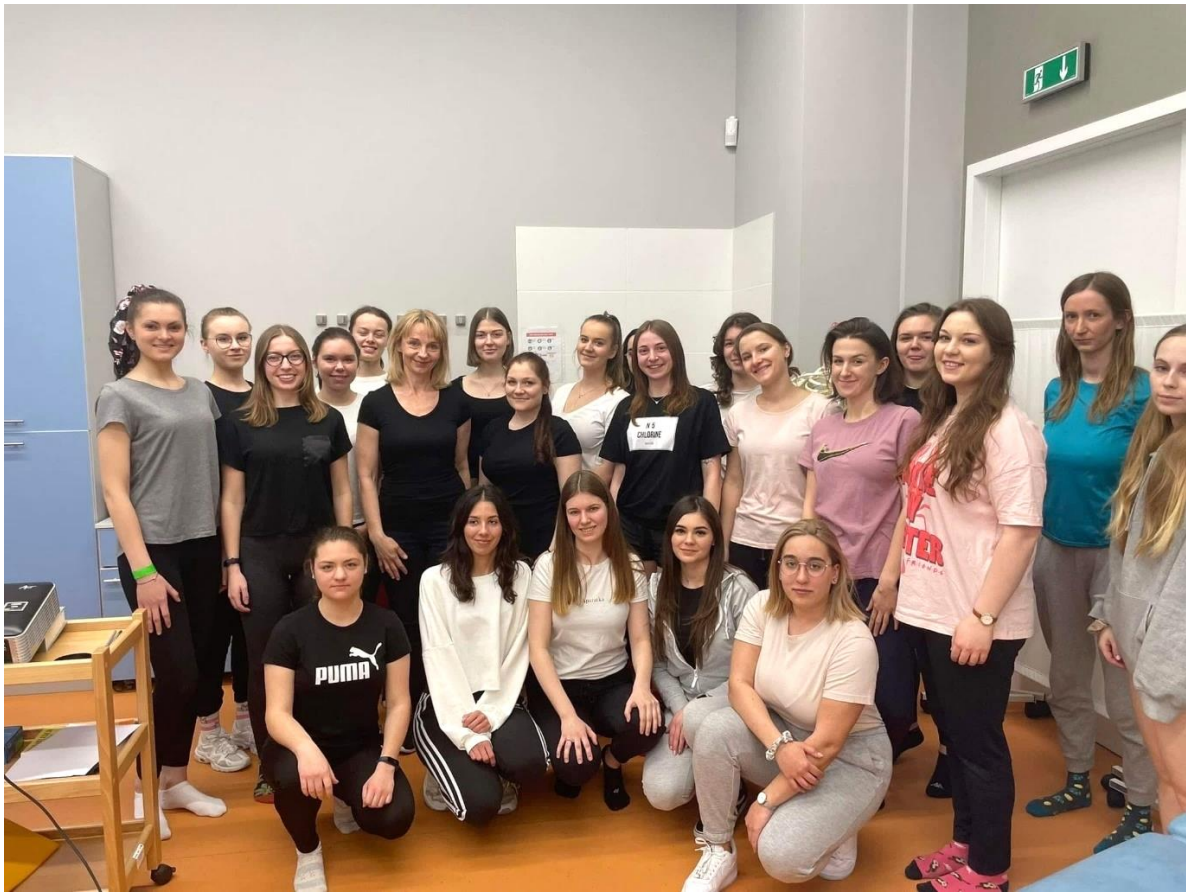
fol.10–Ogólnopolska Studencka Konferencja „Wiosna z Fizjoterapią”, w dn. 8-9 kwietnia 2022 r.