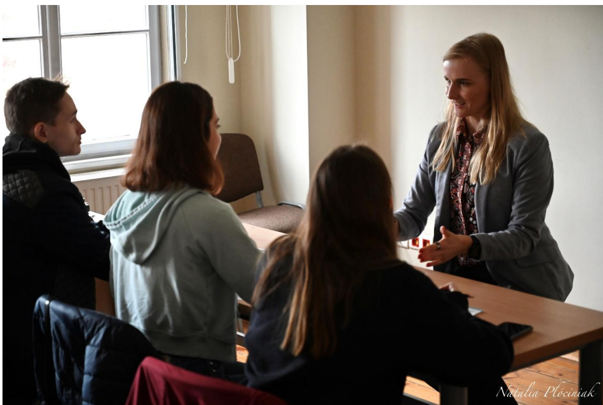
fot. 51 – Warsztat z tajników komunikacji interpersonalnej, Gnieźnieński Piknik Akademicki w ANS Gniezno, dn. 27 maja 2022 r.