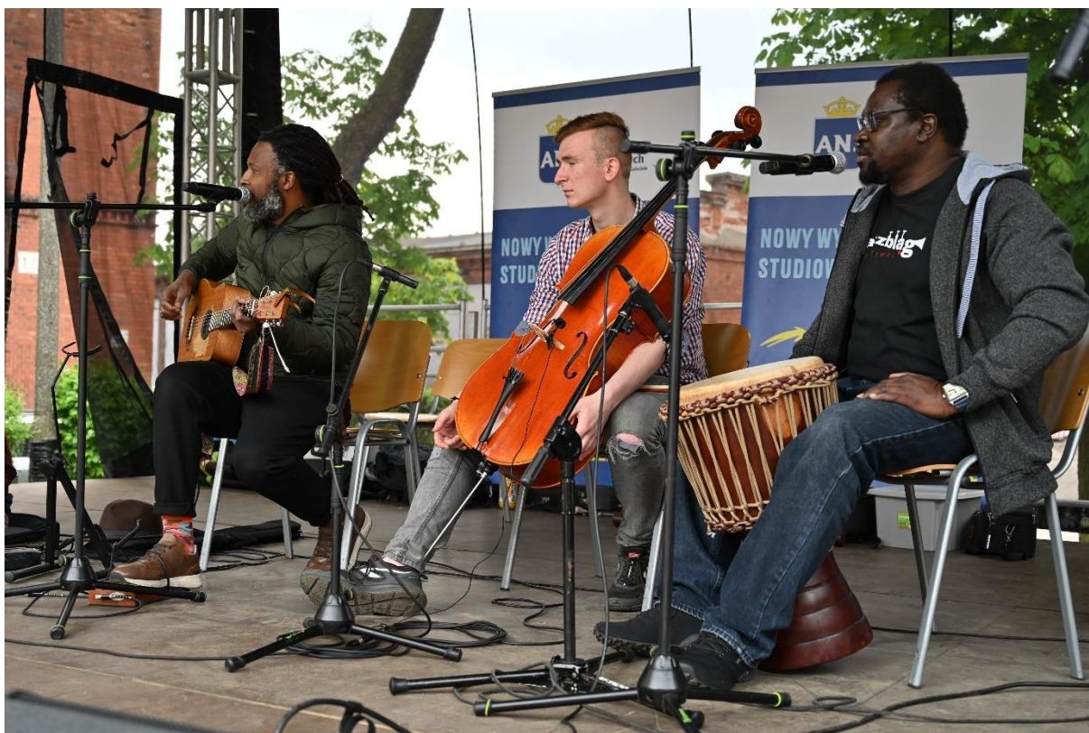
fot. 52 – Koncert muzyki afrykańskiej, Gnieźnieński Piknik Akademicki w ANS Gniezno, dn. 27 maja 2022 r.