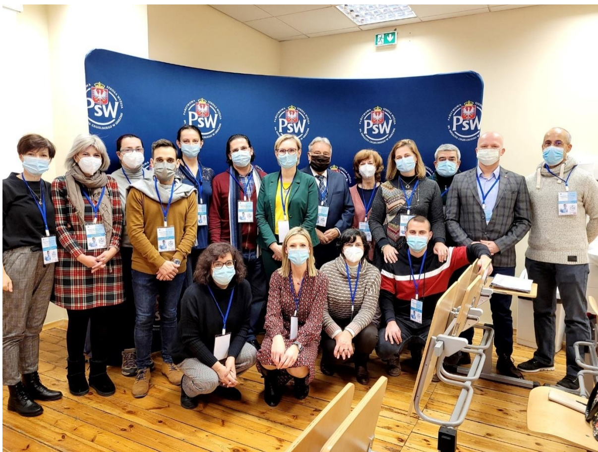
fot. 30 – Zakończenie trzyletniego projektu InovSafeCare, w dn.7-10 grudnia 2021 r., ANS Gniezno