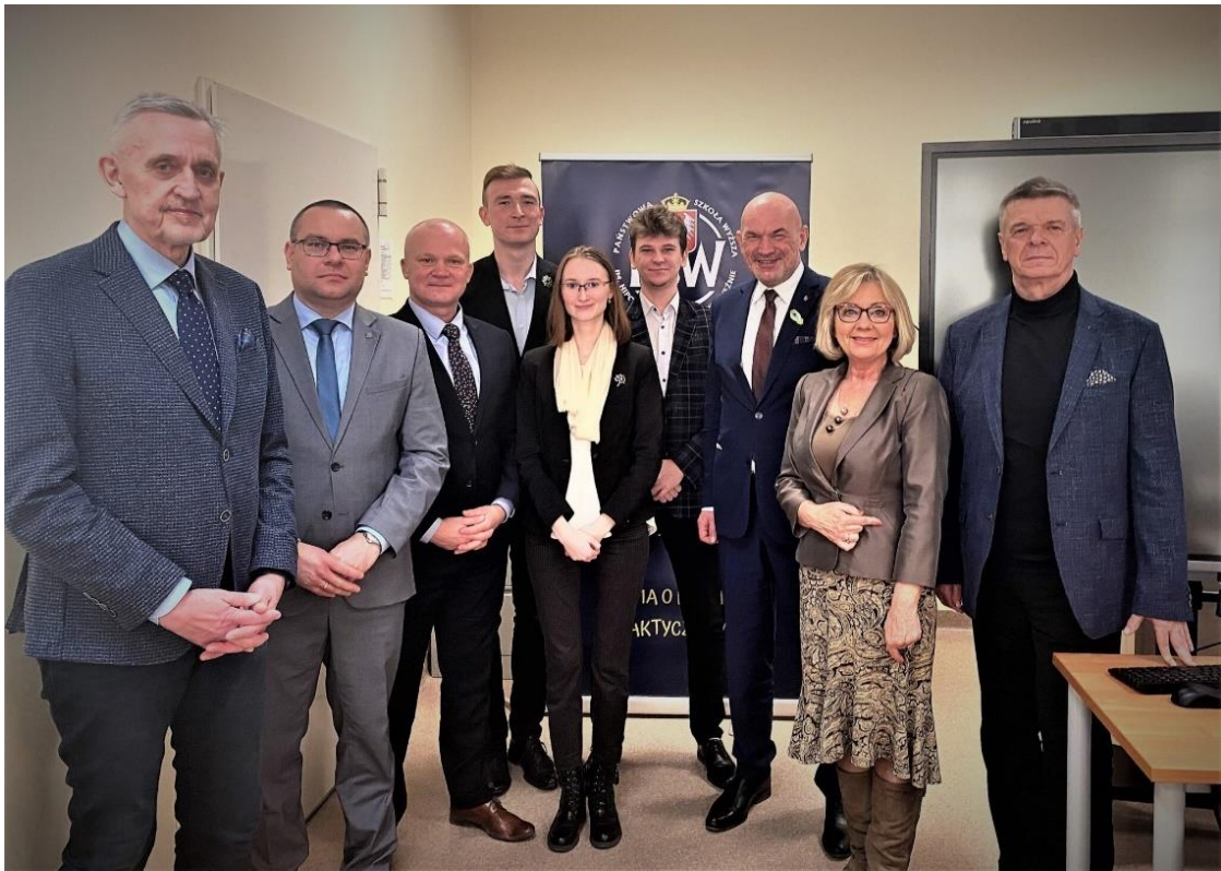
fot. 53 – Spotkanie Prezydium Rady Związku Wielkopolskich Publicznych Uczelni Zawodowych w ANS Gniezno, w dn. 11-12 marca 2022 r.