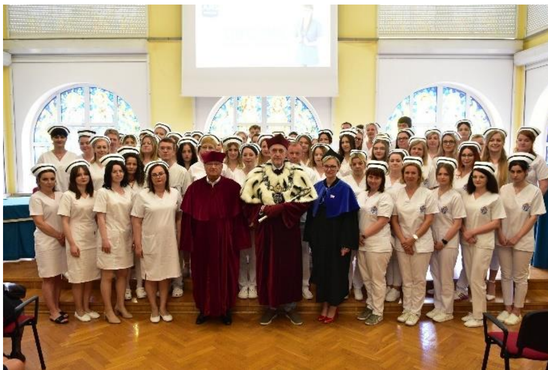
fot. 47–Czekpowanie studentów II i III roku pielęgniarstwa, w dn. 13 maja 2022 r.