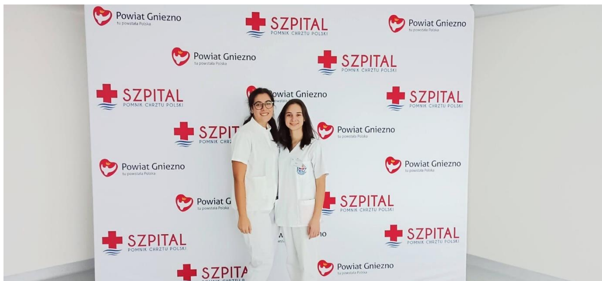
fot. 21 – Studentki uczelni partnerskiej Nursing School of Coimbra w Portugalii, gościnnie na praktykach klinicznych w ANS Gniezno

Wszystkim nauczycielom, przyjaciołom i nauczycielom z działu Erasmusa, którzy zawsze nam pomagali, możemy tylko powiedzieć: Dziękujemy bardzo!”