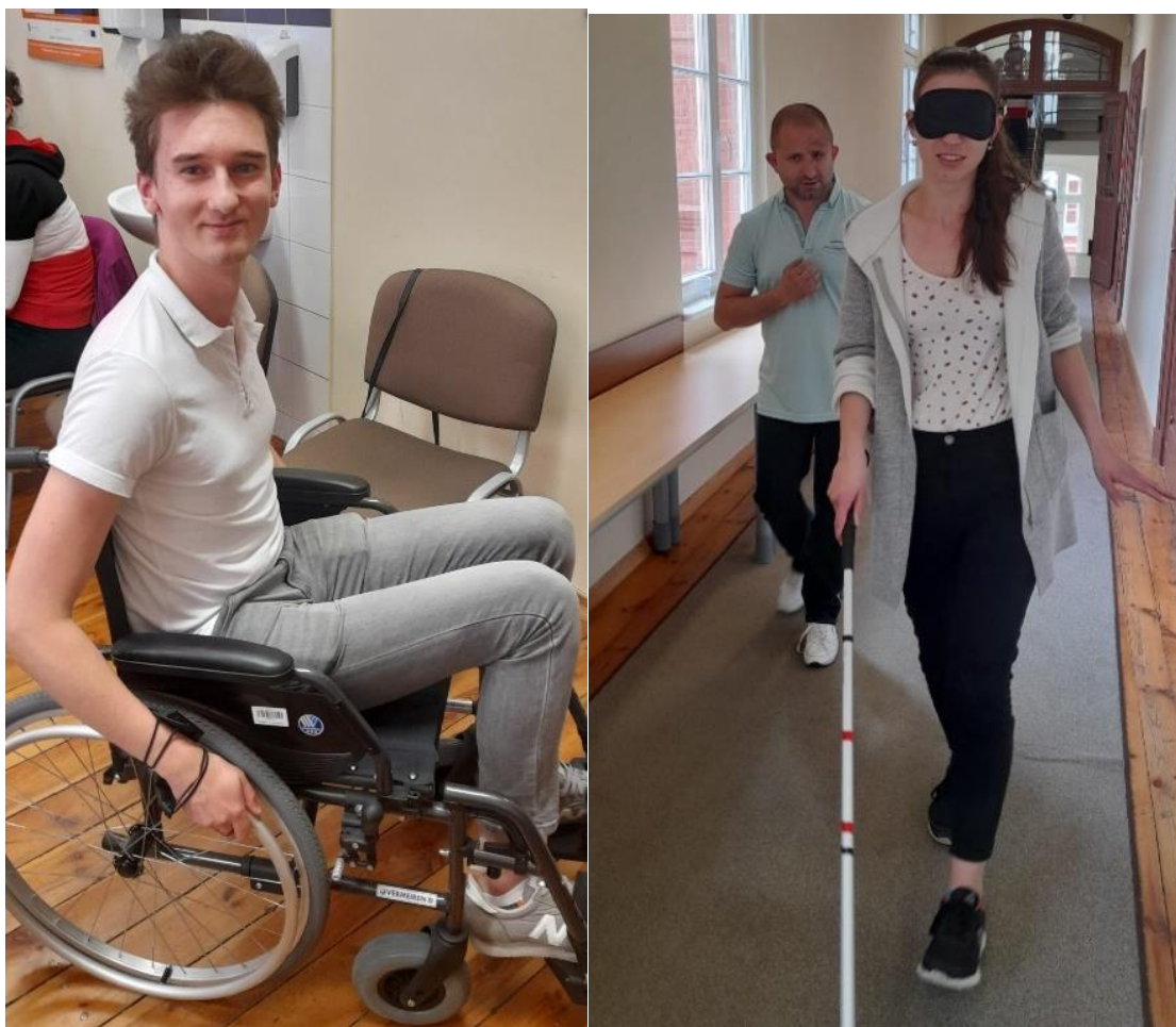
fot.9 - Szkolenie pt.: „Standardy komunikacji, obsługi i savoir vivre - w kontaktach z osobami z niepełnosprawnością”, w dn. 26 maja br.

Dzięki praktycznemu charakterowi w/w szkolenia, tematyka związana z szeroko pojętą „niepełnosprawnością” została przedstawiona w sposób interesujący i emocjonalny, co znacznie podniosło jakość warsztatów i zwiększyło świadomość uczestników w/w warsztatu.