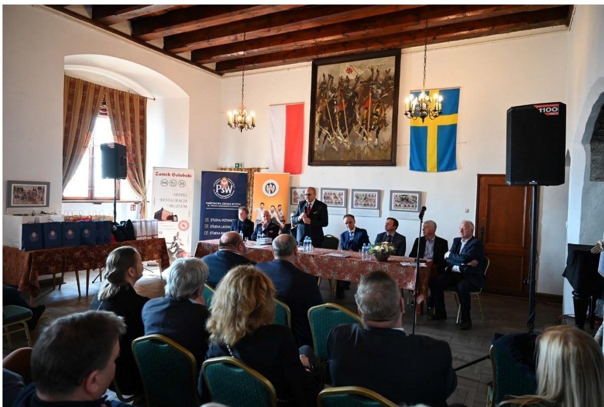
fot. 38 – Międzynarodowy Konkurs Wiedzy Historycznej na Zamku Golubskim, dn. 22 kwietnia 2022 r.