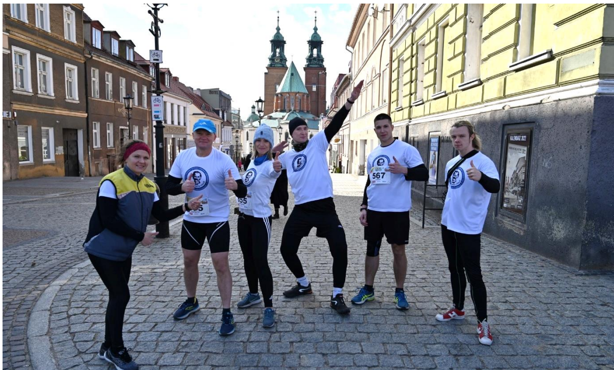
fot. 56 – Reprezentacja ANS Gniezno podczas XIX Biegu Europejskiego w Gnieźnie, dn. 9 kwietnia 2022 r.