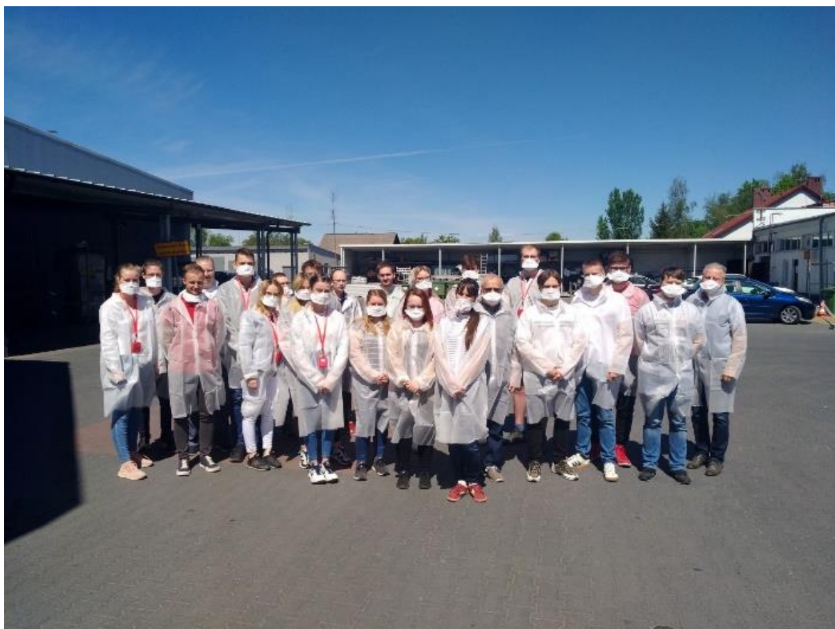
fot.15 – Studenci kierunków inżynierskich na wizycie studyjnej w firmie JENOX w Chodzieży