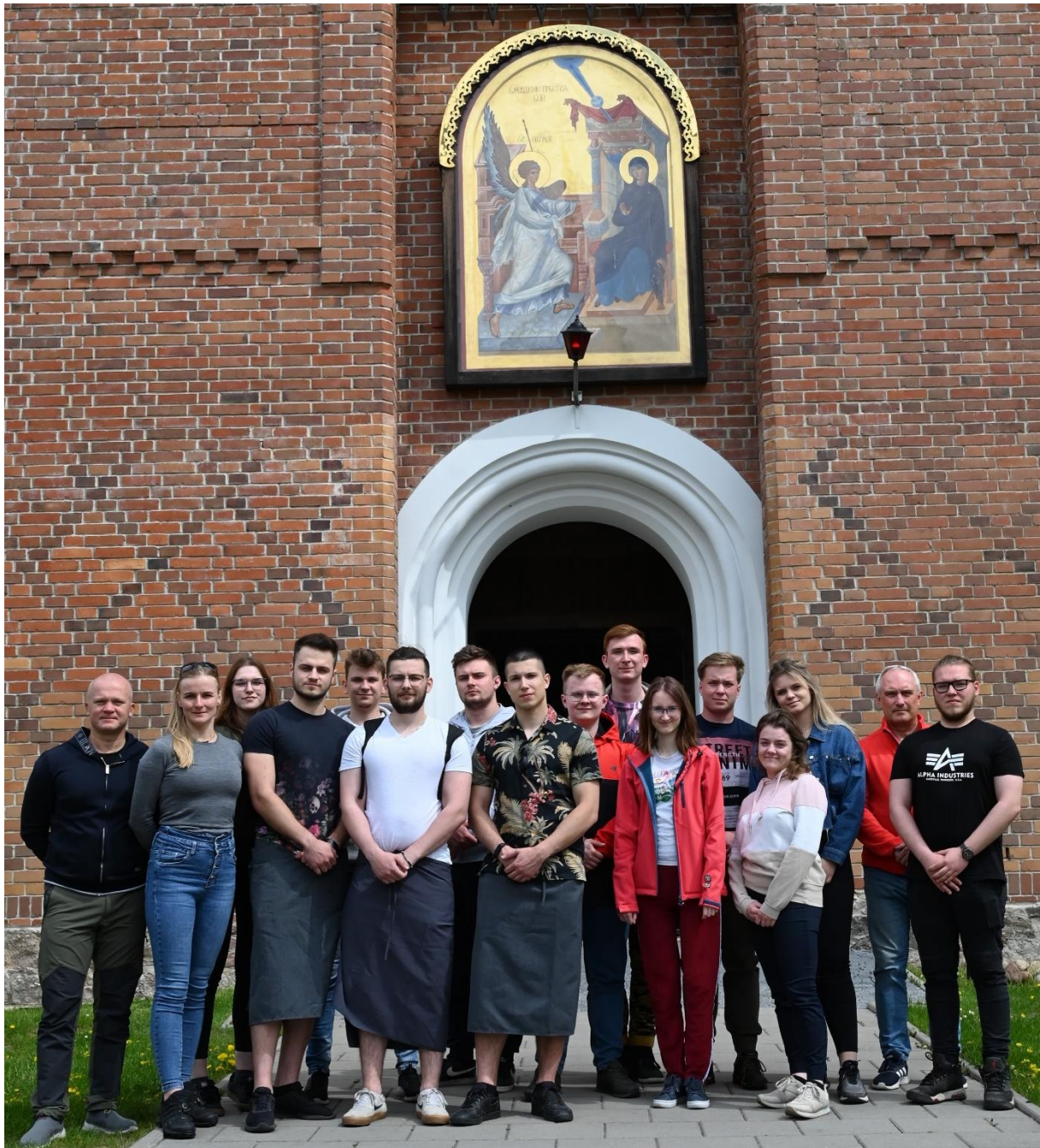
fot.16 – Podróż studyjna studentów analityki bezpieczeństwa do Białowieży, w dn. 11-15 maja 2022 r.