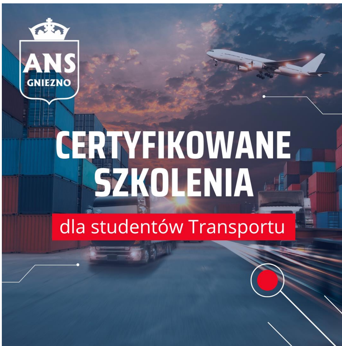
fol.14 – Szkolenie z systemu QGIS w zarządzaniu transportem