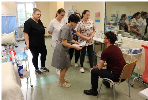
fol. 118 Akcja „Nocny dyżur” w ANS Gniezno

Studenci II i III roku kierunku Pielęgniarstwa i pracownicy Akademii Nauk Stosowanych w Gnieźnie wzięli udział w akcji "NOCNY DYŻUR". Studenci mogli wykazać się swoimi umiejętnościami podczas opieki nad pacjentami, którzy zgłosili się do nich z ciekawymi przypadkami chorobowymi, na symulowanych oddziałach chirurgii ogólnej, chorób wewnętrznych, neurologii i psychiatrii oraz w izbie przyjęć.