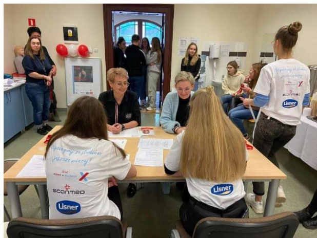
fot. 110 Akcja DKMS w murach ANS Gniezno 17-23.04.2023r.