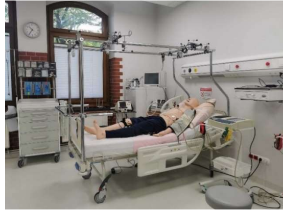
fot. 8 Warsztaty symulacji medycznej w Słupsku