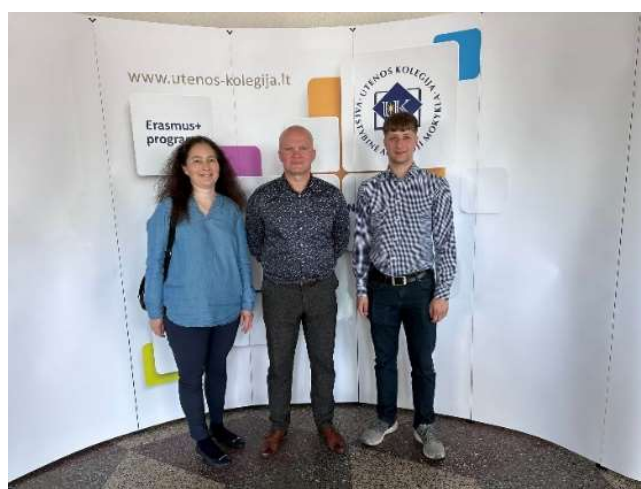
fot. 82 Wizyta Prorektora ANS Gniezno w uczelni partnerskiej Utenos Kolegija na Litwie