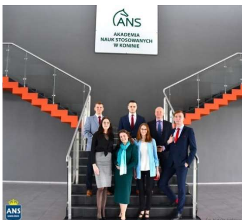
fot. 112 | Ogólnopolska Studencka Konferencja Naukowej "Współczesne Bezpieczeństwo Międzynarodowe w Spojrzeniu Generacji Y"