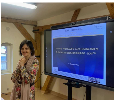
fot. 33 Szkolenie „Studium przypadku z zastosowaniem słownika pielęgniarskiego – ICNP”