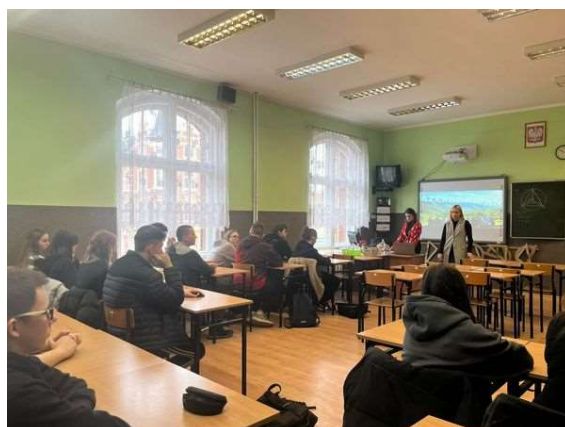
fot. 98 Warsztaty dla maturzystów w III LO w Grudziądzu