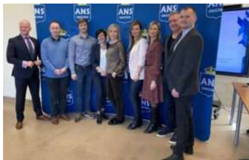
fot. 58 Wizyta partnerskiej uczelni z Litwy