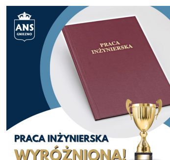
fot. 6 Wyróżnienie pracy dyplomowej inżynierów ANS Gniezno

Praca dyplomowa powstała w czasach pandemii, kiedy wskazane było ograniczanie kontaktów międzyludzkich. Wiele branż gospodarki zostało przez pandemię zmuszonych do zmian w swoim funkcjonowaniu. Autorzy pracy dyplomowej zaproponowali