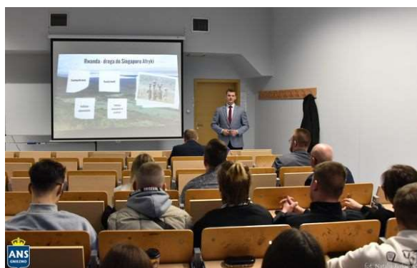
fot. 114 | Ogólnopolska Studencka Konferencja Naukowej "Współczesne Bezpieczeństwo Międzynarodowe w Spojrzeniu Generacji Y"