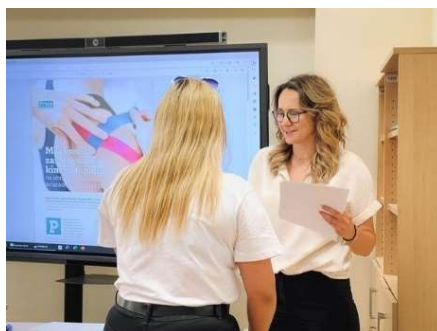
fot. 53 Zebranie członków Koła Naukowego Studentów Fizjoterapii 13.06.2023

Zrecenzowany artykuł, którego autorami są Członkowie KNSF, został opublikowany w najnowszym, 2. numerze kwartalnika „Rehabilitacja w praktyce”. Czasopismo jest indeksowane w bazie Ministerstwa Edukacji i Nauki oraz w bazie Index Copernicus.