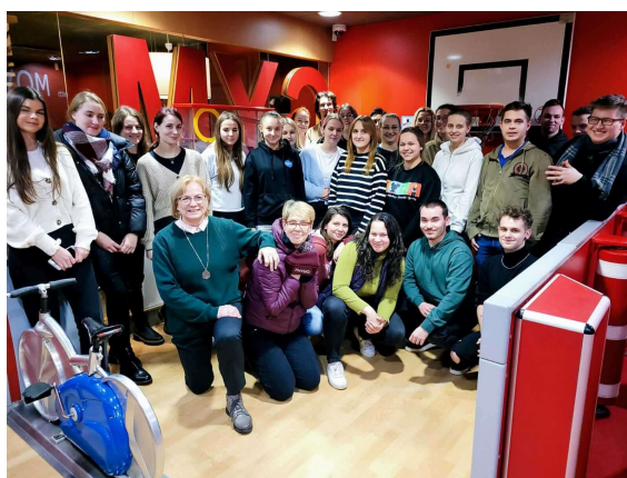
fot. 25 Podróż studyjna do Plastinarium 21.11.2022r.