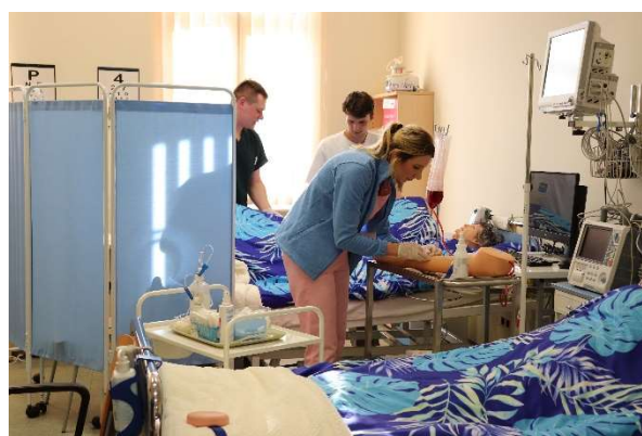
fol. 120 Akcja „Nocny dyżur” w ANS Gniezno