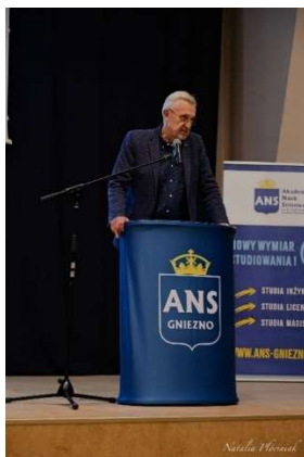
fot. 10 Konferencja „Kryptowaluty i analizy finansowe blockchain”