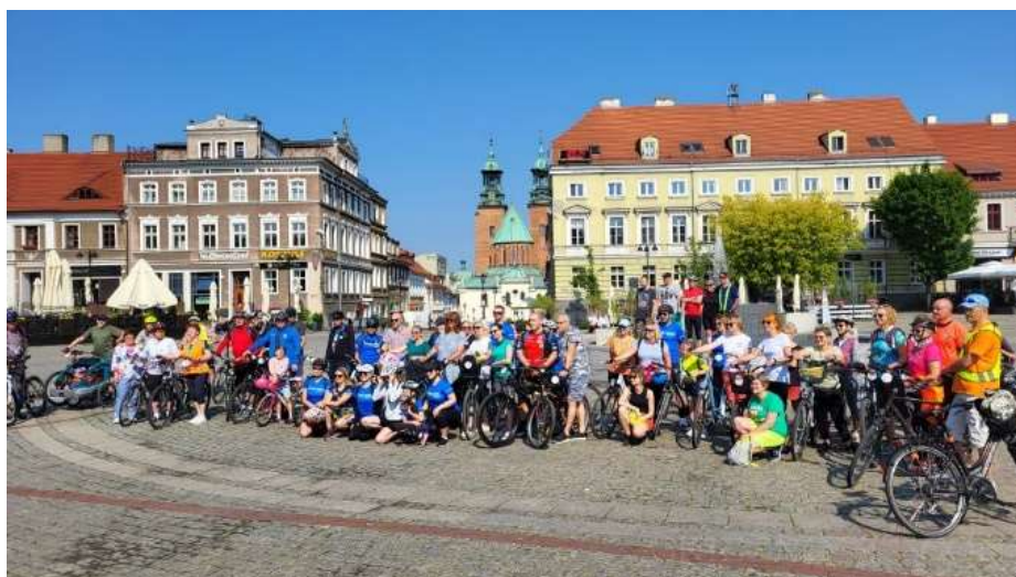
fot. 147 Rajd rowerowy bibliotekarzy 17.06.2023 r.

Biblioteka Akademii Nauk Stosowanych im. Hipolita Cegielskiego w Gnieźnie Uczelnia Państwowa była jednym z organizatorów VIII edycji Rajdu OBJAZDOWY Bibliotekarz. Rajd odbył się 17 czerwca 2023r. i jak zwykle cieszył się dużym zainteresowaniem wśród miłośników rowerów.