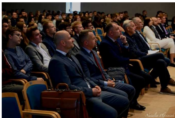
foto. 12 Konferencja „Kryptowaluty i analizy finansowe blockchain” foto. 13 Konferencja „Kryptowaluty i analizy finansowe blockchain”

Konferencja cieszyła się ogromnym zainteresowaniem, udział w niej wzięło ponad 400 osób, w tym studenci i uczniowie ze szkół ponadpodstawowych: I Liceum Ogólnokształcącego im. Bolesława Chrobrego w Gnieźnie, Zespołu Szkół w Mogilnie, II Liceum Ogólnokształcącego im. Dąbrówki w Gnieźnie, Zespołu Szkół Ogólnokształcących i Zawodowych w Trzemesznie, Zespołu Szkół Ekonomicznych w Gnieźnie, TEB Edukacja w Gnieźnie, Szkół Mundurowych Doskonalenia Zawodowego w Gnieźnie, III Liceum Ogólnokształcącego im. Jana Pawła II w Grudziądzu oraz Zespołu Szkół Technicznych im. Papieża Jana Pawła II w Gnieźnie.