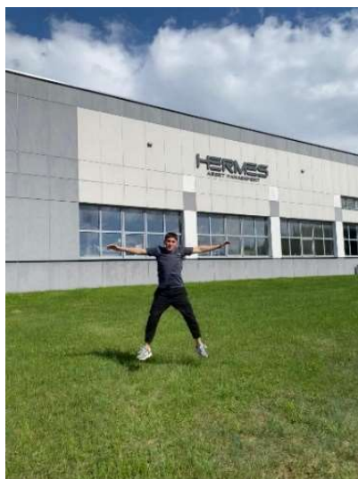
fot. 75 Student TiL na praktykach zawodowych na Litwie