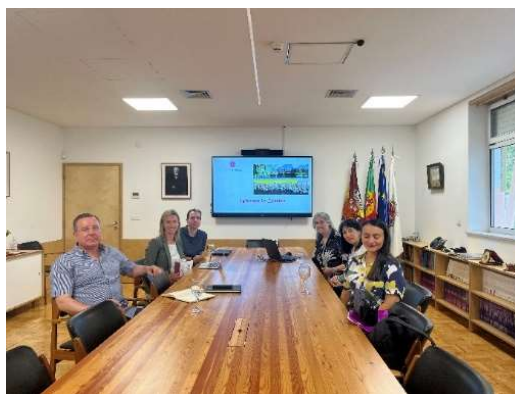
fot. 83 Koordynator Programu Erasmus+ w Nursing School of Coimbra