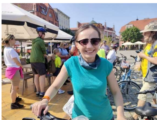
fot. 149 Rajd rowerowy bibliotekarzy 17.06.2023 r.