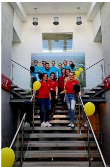
fot. 116 Prelekcja oraz warsztaty na temat ergonomii pracy w firmie Velux