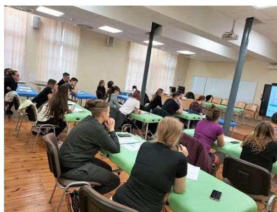
fot.32 Kurs „Kompleksowa diagnostyka narządu ruchu w fizjoterapii”