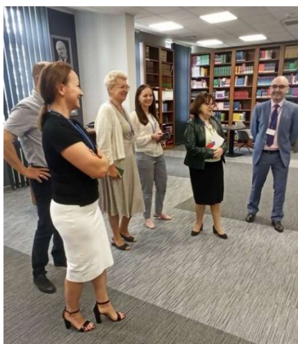
fot. 139 Spotkanie przedstawicieli bibliotek w ramach WZPUZ w Pile