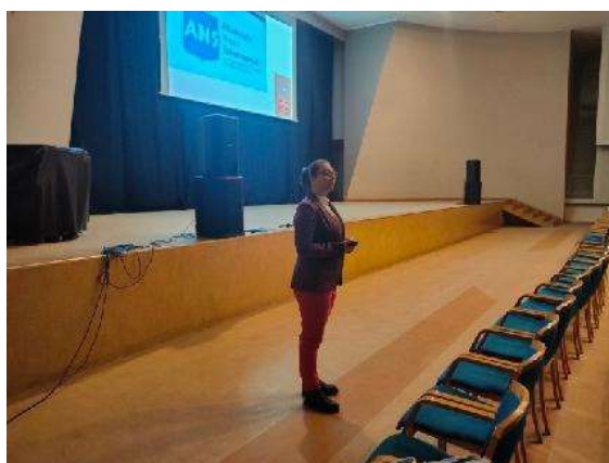
fot. 101 Spotkanie z maturzystami I LO w Gnieźnie