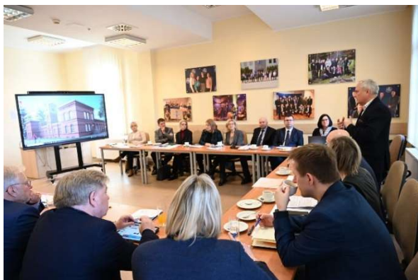
fot. 133 Spotkanie w ramach ZWPUZ