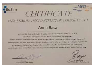
fot. 42 Certyfikat kursu instruktorskiego