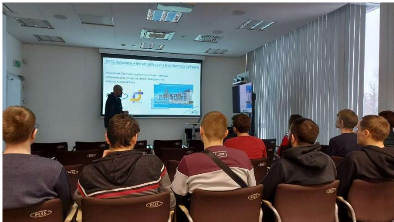
fot. 21 Wyjazd studyjny do PCSS