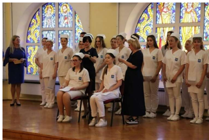
fot. 129 Uroczystość czepkowania studentów II roku pielęgniarstwa