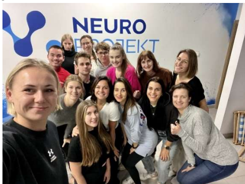
fot. 43 Szkolenie „Terapia przepon w terapii narządów wewnętrznych”

Członkowie Koła Naukowego Studentów Fizjoterapii 21 października 2022r. uczestniczyli w specjalistycznym kursie pt.: "Terapia przepon w terapii narządów wewnętrznych." Podczas w/w warsztatu studenci fizjoterapii w ANS Gniezno mieli możliwość zagłębienia się w zagadnienia związane z: anatomią i palpacją przepon oraz otaczających ją tkanek, poznać techniki terapii manualnej, które można wykorzystać w terapii przepon oraz terapii narządów wewnętrznych, a także omawiali z instruktorem najciekawsze przypadki pacjentów, którzy zgłaszali tego typu dolegliwości. Po zakończeniu warsztatu wszyscy uczestnicy otrzymali certyfikat potwierdzający ich udział w kursie.