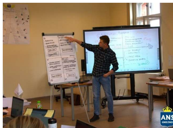
fot. 61 Zajęcia z ustrukturyzowanej analizy informacji 24-27.04.2023r.