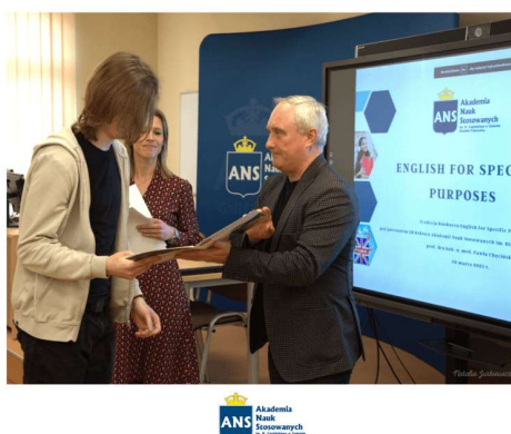
fol. 107 II. Edycja konkursu z j. angielskiego w ANS Gniezno