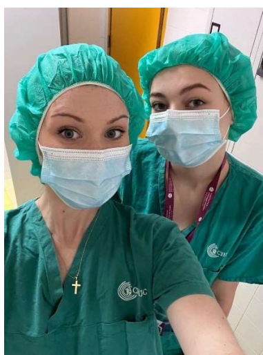
fot. 69 Praktyki studenckie studentek Pielęgniarstwa w Portugalii