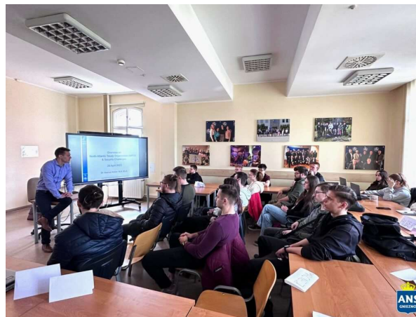
fot. 60 Zajęcia z ustrukturyzowanej analizy informacji 24-27.04.2023r.