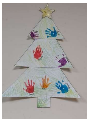
fot. 88 Mikołajki w Szpitalu Pomnik Chrztu Polski