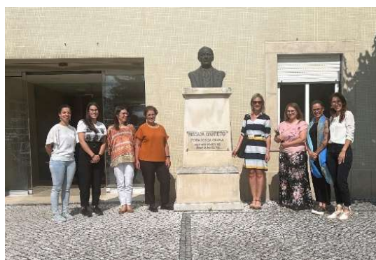
fot. 84 Koordynator Programu Erasmus+ w Nursing School of Coimbra