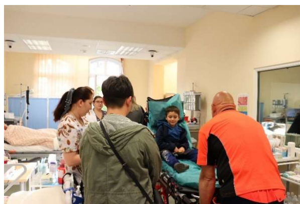
fol. 122 Akcja „Nocny dyżur” w ANS Gniezno