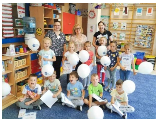
fot. 51 Wizyta studentów Koła Naukowego Fizjoterapii i Pielęgniarstwa w przedszkolu

Podczas spotkania wręczano przedszkolakom drobne upominki od ANS Gniezno, m.in. orderki uśmiechu, balony, kolorowanki oraz pamiątkowe dyplomy.