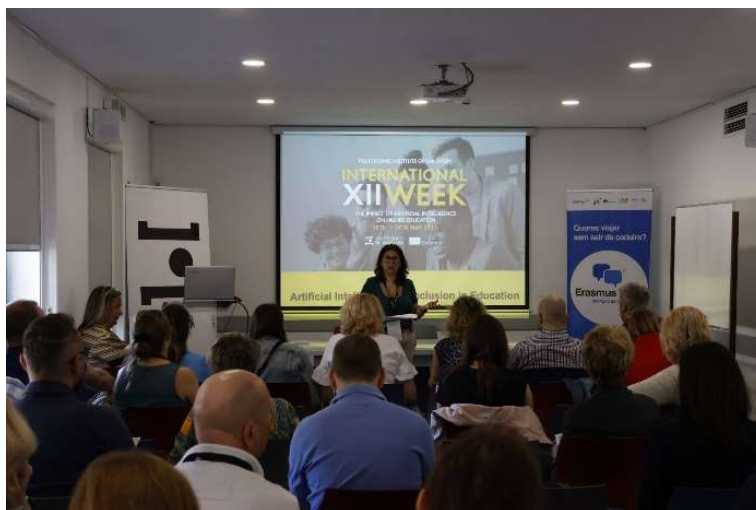
fot. 79 Staff week- Santarem Portugalia.