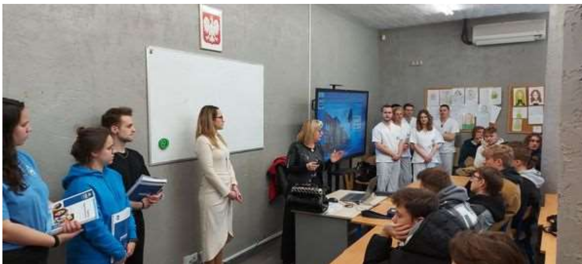
fot. 102 Zespół ANS Gniezno na Targach Edukacyjnych