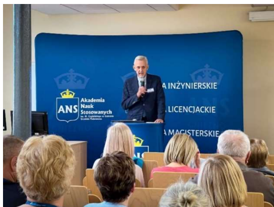
fot. 123 Warsztaty „Seniorze sam decyduj o jakości twojego życia”