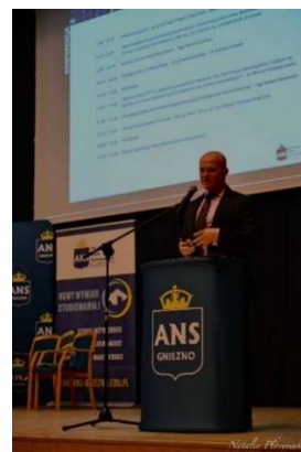
fot. 11 Konferencja „Kryptowaluty i analizy finansowe blockchain”