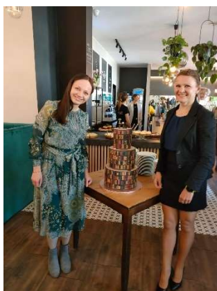
fot. 146 Dzień Bibliotek i Bibliotekarzy 8.05.2023 r.