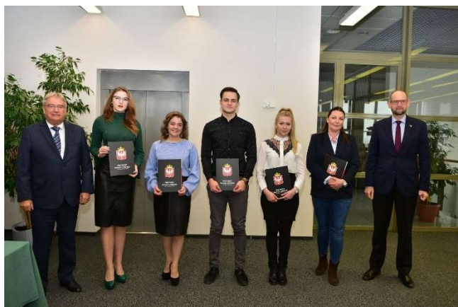
fot. 5 Rozdanie stypendiów Miasta Gniezna 2022r.

Aby otrzymać stypendium naukowe Miasta Gniezna należy między innymi spełnić następujące kryteria: być studentem szkoły wyższej działającej na terenie miasta Gniezna w systemie studiów stacjonarnych oraz posiadać średnią ocen ze wszystkich zaliczeń i egzaminów w roku akademickim poprzedzającym rok akademicki, w którym stypendium ma być przyznane nie niższą niż 4,50 dla Polaków i 4,0 dla Ukraińców.