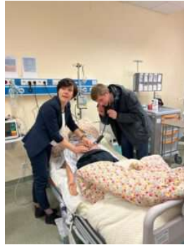
fot. 59 Wizyta partnerskiej uczelni z Litwy