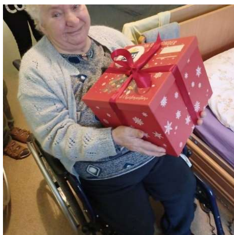
fot. 91 Akcja społeczna „Anielskie skrzydła”