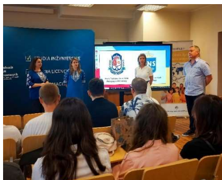
foto. 64 Wizyta wykładowców z Ukrainy 29.05.2023r.- 04.06.2023r.