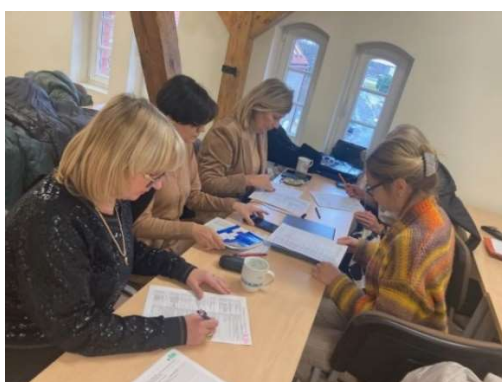
fot. 35 Szkolenie „Studium przypadku z zastosowaniem słownika pielęgniarstwa – ICNP”