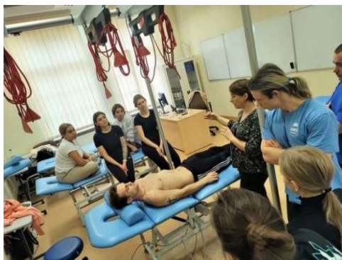
fot. 47 Szkolenie „Hipertonia dna miednicy i jej wpływ na bolesne miesiączkowanie i współżycie. Diagnostyka i terapia”