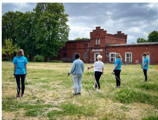
fot. 126 Warsztaty „Seniorze sam decyduj o jakości twojego życia”