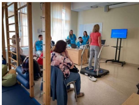
fot. 125 Warsztaty „Seniorze sam decyduj o jakości twojego życia”