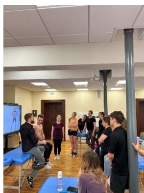
fot. 38 Warsztaty teoretyczno-praktyczne z FRSC

Studenci poznali główne założenia metody, sposoby diagnozowania oraz rodzaje typologii pacjenta. W praktyczny sposób studenci również poznali jak wygląda terapia oraz mogli doświadczyć jej na sobie.