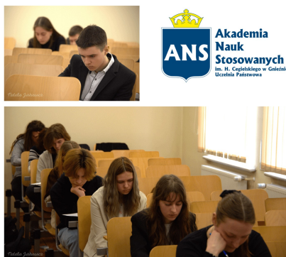
fol. 106 II. Edycja konkursu z j. angielskiego w ANS Gniezno