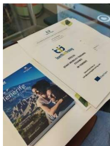
fot. 77 Pracownicy administracji ANS Gniezno na szkoleniu Staff Mobility For Training