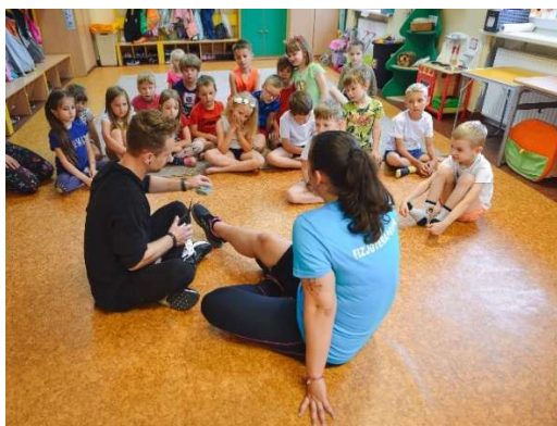
fot. 52 Wizyta studentów Koła Naukowego Fizjoterapii i Pielęgniarstwa w przedszkolu