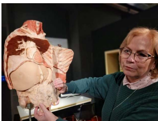
fot. 27 Podróż studyjna do Plastinarium 21.11.2022r.