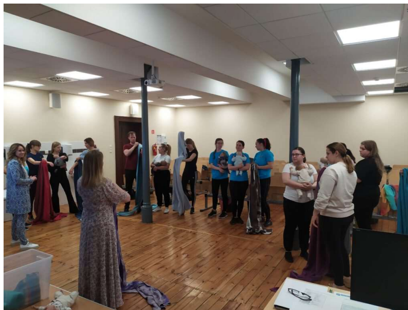
fot. 50 Warsztaty "jak bezpiecznie wspierać rozwój dziecka poprzez noszenie w chuście?"