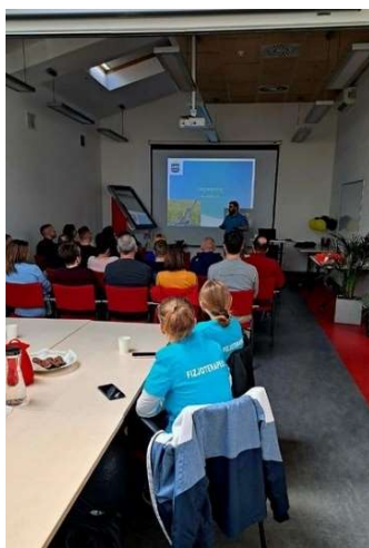
fot. 117 Prelekcja oraz warsztaty na temat ergonomii pracy Velux