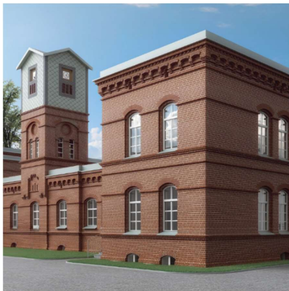
fot. 1 Kampus akademicki - budynek nr 7

Akademia Nauk Stosowanych im. H. Cegielskiego w Gnieźnie Uczelnia Państwowa jest w trakcie adaptacji budynku pokoszarowego nr 7 na terenie Kampusu. Jest to kolejny budynek remontowany przez Naszą Uczelnię przy ul. Wrzesińskiej w Gnieźnie, który jest wpisany do Wojewódzkiego Rejestru Zabytków. Realizacja inwestycji pozwoli na przeniesienie Rektoratu z budynku przy ul. Wyszyńskiego na teren Kampusu. Remontowany budynek będzie wizytówką Naszej Uczelni, zostanie tam oddana do użytku społeczności akademickiej aula na 260 osób, która będzie mogła zostać podzielona na trzy mniejsze sale wykładowe. W budynku nr 7 będzie również biblioteka z czytelnią, bar studencki oraz sala Senatu. Na honorowym miejscu zostanie umieszczone popiersie Patrona Uczelni Hipolita Cegielskiego. Budynek wyróżni się wśród pozostałych obiektów pokoszarowych przy ul. Wrzesińskiej piękną wieżą zegarową, na której będą znajdowały się cztery zegary z kurantem.