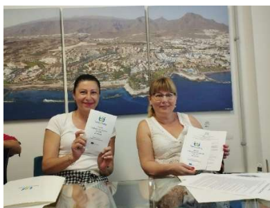
fot. 76 Pracownicy administracji ANS Gniezno na szkoleniu Staff Mobility For Training

interesujących rozmów dotyczących możliwości współpracy pomiędzy w/w instytucjami, wymiany doświadczeń na temat realizowanych projektów z zakresu K2 – Cooperation for Innovation and the Exchange of Good Practices oraz dyskusji na temat różnorodnych form promocji związanych ze zwiększeniem mobilności wśród studentów, wykładowców oraz pracowników administracji uczelni. Niewątpliwie atrakcyjnym atutem udziału w Programie Erasmus+ było również zwiększenie kompetencji językowych, możliwość poznania kultury hiszpańskiej, zasmakowania specjałów lokalnej kuchni oraz odkrycia wielu ciekawych miejsc i możliwość poznania fantastycznych ludzi.