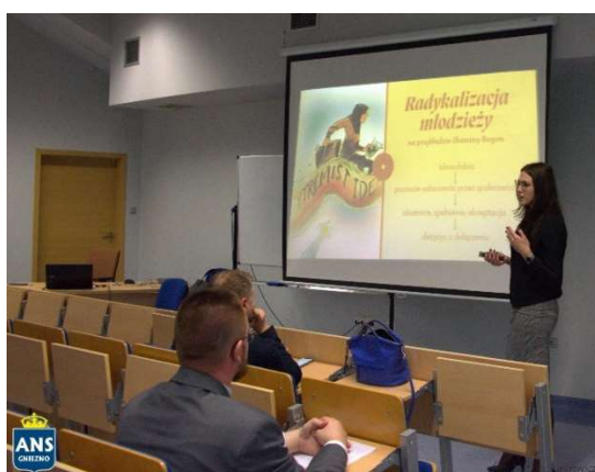
fot. 113 | Ogólnopolska Studencka Konferencja Naukowej "Współczesne Bezpieczeństwo Międzynarodowe w Spojrzeniu Generacji Y"