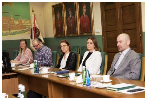
fot. 141 Spotkanie przedstawicieli Działów Współpracy z Zagranicą zrzeszonych w ZWPUZ