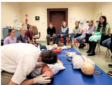
fot. 93 Wizyta w ANS młodzieży z Językowego Liceum Ogólnokształcącego Prymus w Gnieźnie

Zajęcia z pierwszej pomocy medycznej poprowadzili studenci II roku pielęgniarstwa.