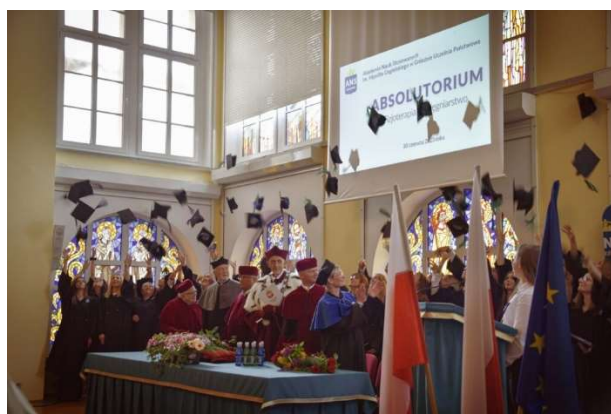
fol. 132 Uroczystość Absolutorium studentów pielęgniarstwa i fizjoterapii