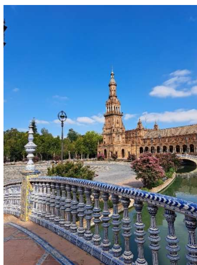
fot. 71 Praktyki studentki Fizjoterapii w Hiszpanii