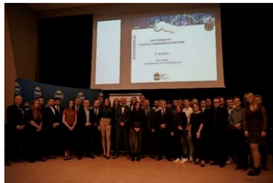
fot. 9 Konferencja „Kryptowaluty i analizy finansowe blockchain”