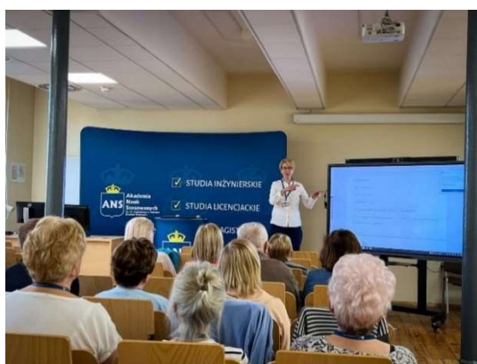
fot. 124 Warsztaty „Seniorze sam decyduj o jakości twojego życia”