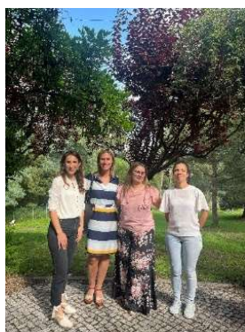
fot. 85 Koordynator Programu Erasmus+ w Nursing School of Coimbra