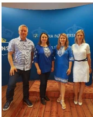
foto. 62 Wizyta wykładowców z Ukrainy 29.05.2023r.- 04.06.2023r.