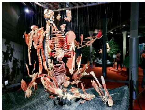
fot. 28 Podróż studyjna do Plastinarium 21.11.2022r.