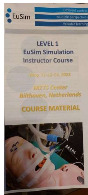
fot. 40 Kurs instruktorski symulacji medycznej