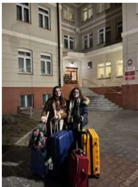
fot. 66 fot. 67 Wizyta studentek z uczelni partnerskiej Nursing School of Coimbra