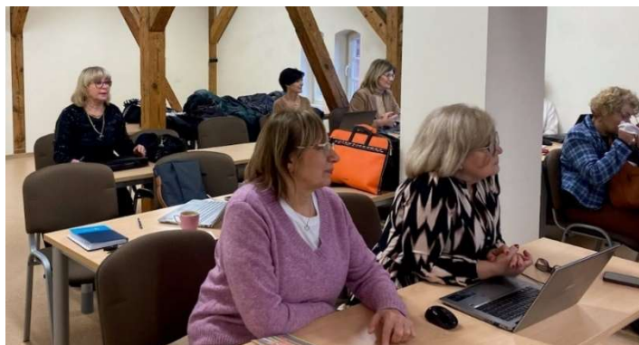
fot. 36 Szkolenie „Studium przypadku z zastosowaniem słownika pielęgniarstwa – ICNP”