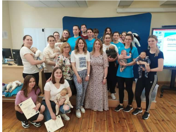
fot. 49 Warsztaty "jak bezpiecznie wspierać rozwój dziecka poprzez noszenie w chuście?"