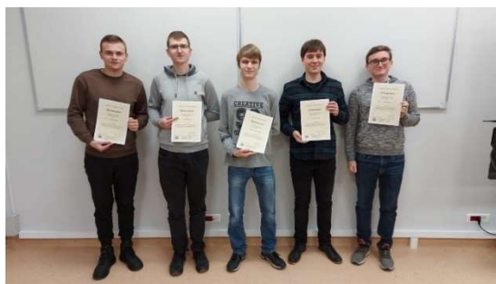
fot. 24 Szkolenie z programowania instalacji inteligentnych w standardzie LCN