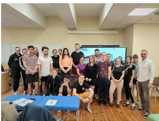
fot. 31 Kurs „Kompleksowa diagnostyka narządu ruchu w fizjoterapii”

Dodatkowo omówiono badania obrazowe, a w części praktycznej uczestnicy samodzielnie wykonywali testy kliniczne na wybranych przypadkach klinicznych. W kursie uczestniczyła pierwsza grupa studentów z V i IV roku fizjoterapii.