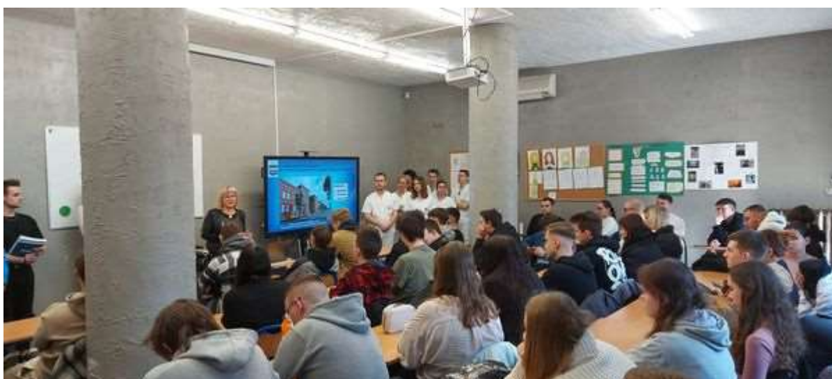
fot. 103 Zespół ANS Gniezno na Targach Edukacyjnych