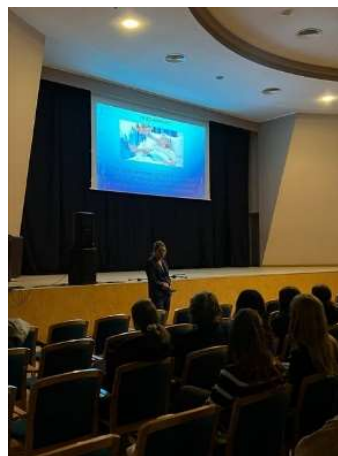
fot. 100 Spotkanie z maturzystami I LO w Gnieźnie