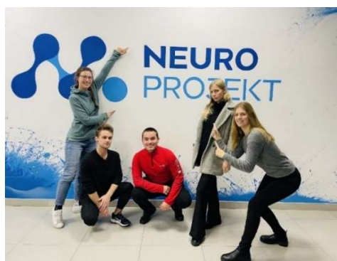
fot. 44 Szkolenie „Terapia przepon w terapii narządów wewnętrznych”