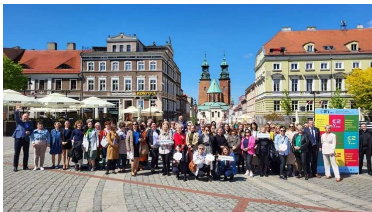
fot. 145 Dzień Bibliotek i Bibliotekarzy 8.05.2023 r.