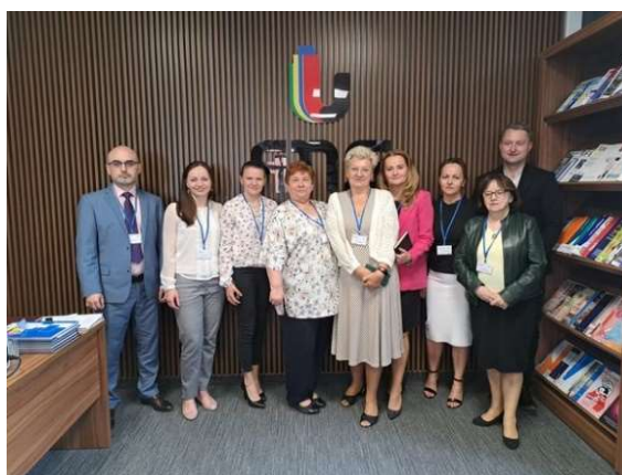
fot. 136 Spotkanie przedstawicieli bibliotek w ramach WZPUZ w Pile

23 maja 2023r. z inicjatywy Wielkopolskiego Związku Publicznych Uczelni Zawodowych pracownicy Biblioteki ANS Gniezno uczestniczyli w spotkaniu przedstawicieli bibliotek uczelni zawodowych. Spotkaniu towarzyszyło zwiedzanie Biblioteki Głównej Akademii Nauk Stosowanych im. Stanisława Staszica w Pile, prezentacja zasobów i prowadzonych działań oraz bazy dydaktycznej Uczelni. Wspólne spotkanie było doskonałą okazją do wymiany doświadczeń, praktyk oraz dalszej współpracy wielkopolskich uczelni, które miejmy nadzieję zaowocują ciekawymi inicjatywami.