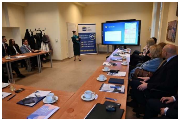
fot. 134 Spotkanie w ramach ZWPUZ