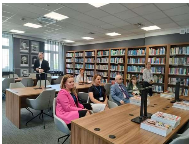
fot. 138 Spotkanie przedstawicieli bibliotek w ramach WZPUZ w Pile