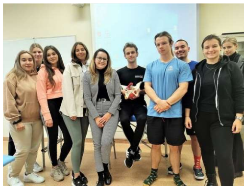
fot. 46 Szkolenie „Hipertonia dna miednicy i jej wpływ na bolesne miesiączkowanie i współżycie. Diagnostyka i terapia”

Warto dodać, że nadmierne napięcie tkanek wchodzących w skład dna miednicy to obszar zainteresowań wielu terapeutów, w tym specjalistów zajmujących się uroginekologią. Manualna i treningowa praca w tym obszarze może przynosić rewelacyjne efekty w takich problemach jak bolesne miesiączkowanie czy ból, bądź dyskomfort pacjentów podczas współżycia.