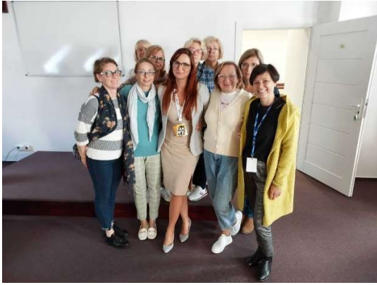
fot. 7 Warsztaty symulacji medycznej w Słupsku