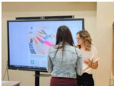
fot. 55 Zebranie członków Koła Naukowego Studentów Fizjoterapii 13.06.2023