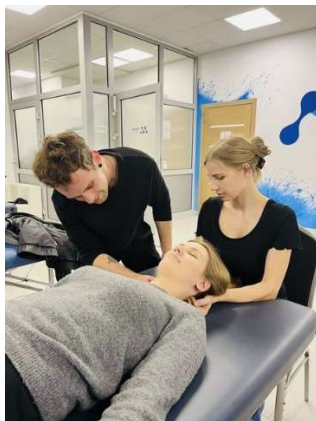
fot. 45 Szkolenie „Terapia przepon w terapii narządów wewnętrznych”