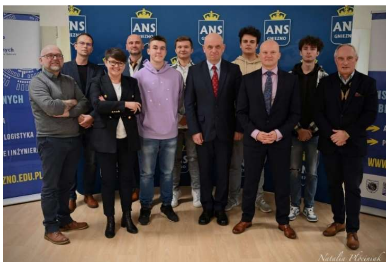
fot. 18 Konferencja „Inwazja Rosji na Ukrainę -ocena konfliktu

Wydarzenie zorganizowane przez Instytut Nauk o Bezpieczeństwie cieszyło się ogromnym zainteresowaniem, udział w konferencji wzięło ponad 160 osób, w tym studenci i uczniowie ze szkół ponadpodstawowych: Zespołu Szkół w Mogilnie, Zespołu Szkół Ogólnokształcących i Zawodowych w Trzemesznie, Zespołu Szkół Ekonomicznych w Gnieźnie, III Liceum Ogólnokształcącego im. Jana Pawła II w Grudziądzu oraz Zespołu Szkół Technicznych im. Papieża Jana Pawła II w Gnieźnie.