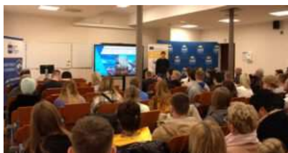
fot. 57 Wizyta partnerskiej uczelni z Litwy