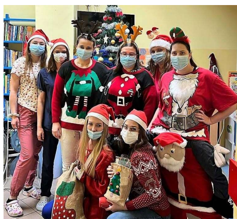
fot. 89 Mikołajki w Szpitalu Pomnik Chrztu Polski