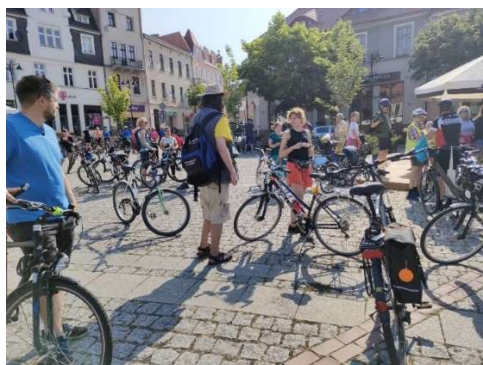
fot. 148 Rajd rowerowy bibliotekarzy 17.06.2023 r.