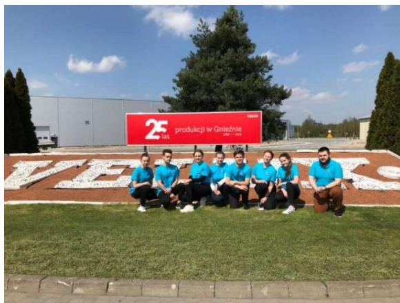
fot. 115 Prelekcja oraz warsztaty na temat ergonomii pracy w firmie Velux

na zdrowie oraz prace pracowników. Studenci fizjoterapii przekazali swoje uwagi oraz możliwe strategie działania wraz z instruktażem ćwiczeń pracownikom produkcyjnym.