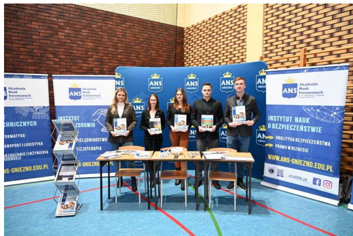
fot. 86 Targi edukacyjne „Mój start w przyszłość”

czas na bezpośrednie pytania oraz rozmowy uczniów ze studentami, którzy mogli opowiedzieć, jak wygląda studiowanie w ANS Gniezno.