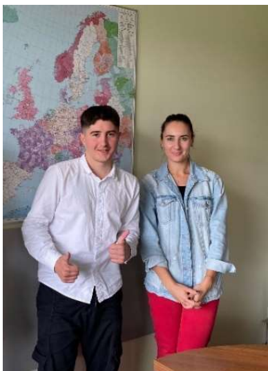
fot. 74 Student TiL na praktykach zawodowych na Litwie

bardzo owocny – nasz student poznał podstawowe zasady logistyki pracując w firmie Hermes, rozwinął umiejętności komunikacji biznesowej, a w chwilach wolnych odkrywał uroki Litwy – zwiedził Wilno, skosztował specjału litewskiej kuchni – Šaltibarščiai (Barszcz Zimny) i poznał wiele inspirujących ludzi.