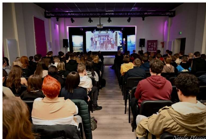
fot. 19 Konferencja „Inwazja Rosji na Ukrainę -ocena konfliktu