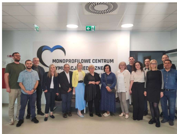
fot. 135 Spotkanie przedstawicieli Akademii Nauk Stosowanych zrzeszonych w WZPUZ

Uczestnicy spotkania zaplanowali kolejne wspólne przedsięwzięcia, które będą miały na celu ujednoczenie egzaminu OSCE na kierunku pielęgniarstwo I stopnia. Wspólne plany będą dotyczyły również organizacji konferencji naukowo-szkoleniowych dla studenckich kół naukowych, a także działań symulacyjnych w MCSM-ach.