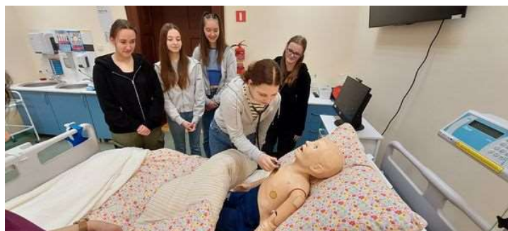
fot. 96 Zajęcia zorganizowane dla Szkoły Podstawowej im. Armii Krajowej w Chełmcach.