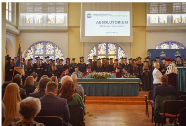
fol. 131 Uroczystość Absolutorium studentów pielęgniarstwa i fizjoterapii