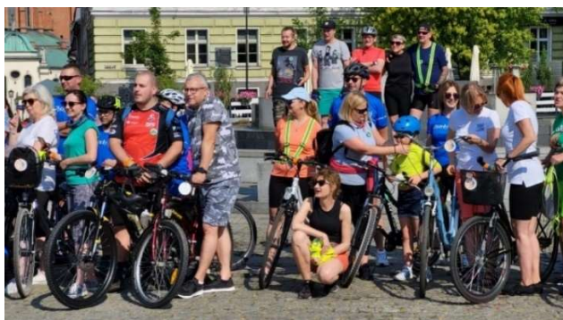
fot. 150 Rajd rowerowy bibliotekarzy 17.06.2023 r.