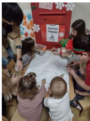
fot. 87 Mikołajki w Szpitalu Pomnik Chrztu Polski

6 grudnia 2022r. członkowie Koła Naukowego Instytutu Nauk o Zdrowiu, odwiedzili Oddział Dzieciątę w Szpitalu Pomnik Chrztu Polski i obdarowali prezentami najmłodszych pacjentów oddziału.