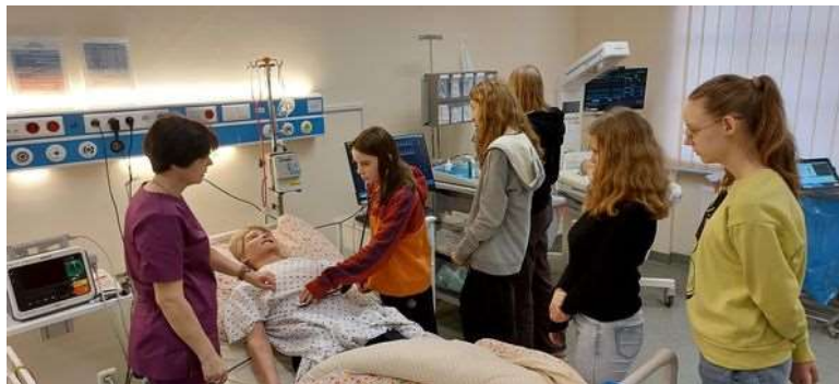
fot. 95 Zajęcia zorganizowane dla Szkoły Podstawowej im. Armii Krajowej w Chełmcach

W zabytkowych murach nowoczesnej Akademii Nauk Stosowanych im. Hipolita Cegielskiego w Gnieźnie Uczelnia Państwowa, miło nam było gościć uczniów kl. 6, 7 i 8 wraz z opiekunami ze Szkoły Podstawowej im. Armii Krajowej w Chełmcach. Goście mieli okazję zapoznać się w ramach preorientacji zawodowej z naszym Monoprofilowym Centrum Symulacji Medycznej i Laboratorium Chemicznym. Kształcą się w nim i zdobywają cenną wiedzę i profesjonalne doświadczenie studenci kierunku Pielęgniarstwo. Uczniowie z zachwytem aktywnie uczestniczyli w praktycznych zajęciach z symulacji medycznej oraz mieli okazję poeksperymentować w laboratorium chemicznym. Zajęcia przygotowali dla nich wykładowcy z Instytutu Nauk o Zdrowiu i studenci kierunku Pielęgniarstwo oraz wykładowcy z Instytutu Nauk Technicznych.