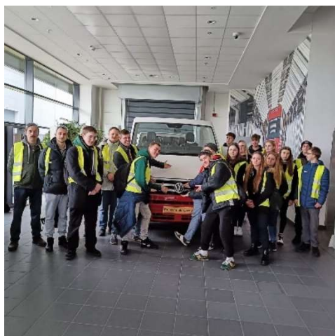
fot. 29 Wizyta w fabryce Volkswagena, 6.12.2022r.

Dnia 06 grudnia 2022r. studenci I i II roku kierunków: TRANSPORT I LOGISTYKA oraz ZARZĄDZANIE I INŻYNIERIA PRODUKCJI, uczestniczyli w wyjeździe studyjnym do fabryki samochodów dostawczych Volkswagen w Białężycach pod Wrześnią. Podczas pobytu na terenie zakładu studenci zwiedzili takie działy jak: Budowy Karoserii oraz Montażu, gdzie niewątpliwie ich uwagę przyciągały przede wszystkim liczne roboty przemysłowe (a jest blisko 500!), które prawie całkowicie zautomatyzowały proces produkcji. W hali montażu podziwiano również organizację pracy na kolejnych liniach montażowych i z zaskoczeniem obserwowano, że co 3 minuty fabrykę opuszcza nowy samochód! Co ciekawe powierzchnia zakładu we Wrześni jest ogromna bo wynosi 220 ha, co w przełożeniu odpowiada 300 boiskom piłkarskim! A na terenie fabryki działa nowoczesna hala budowy karoserii, lakiernia, hala montażu oraz park dostawców, dział samochodów specjalnych oraz dział produkcji pilotażowej.