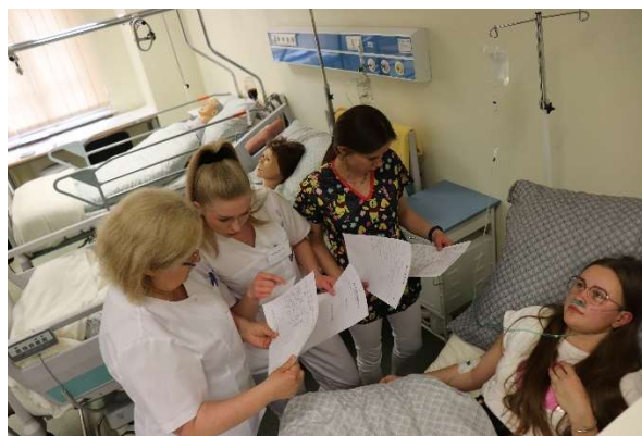
fol. 121 Akcja „Nocny dyżur” w ANS Gniezno