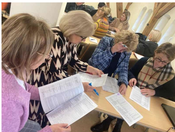
fot. 34 Szkolenie „Studium przypadku z zastosowaniem słownika pielęgniarstwa – ICNP”