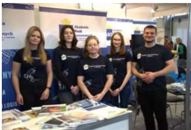
fot. 105 Studenci ANS Gniezno na Targach Edukacyjnych 2023r. w Poznaniu