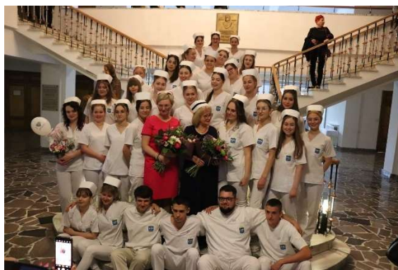
fol. 127 Uroczystość czepkowania studentów II roku pielęgniarstwa

Czepkowanie to uroczystość, podczas której studenci pielęgniarstwa otrzymują białe czepki i symbolicznie dołączają do grona pielęgniarzy / pielęgniarek. Podczas uroczystości odśpiewany został również Hymn Pielęgniarek a przyszli adepci sztuki pielęgniarskiej złożyli uroczyste ślubowanie. W tym roku symboliczny biały czepki i przypinkę do uniformy, odebrało przeszło 30 przyszłych pielęgniarek i pielęgniarzy, studiujących w Akademii Nauk Stosowanych j im. Hipolita Cegielskiego w Gnieźnie Uczelnia Państwowa.