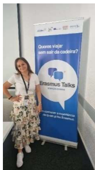
fot. 78 Wykładowca ANS Gniezno na staff week w Portugalii