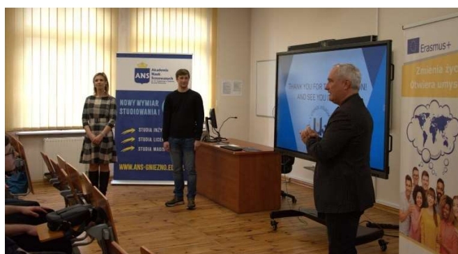
fot. 56 Wizyta partnerskiej uczelni z Litwy