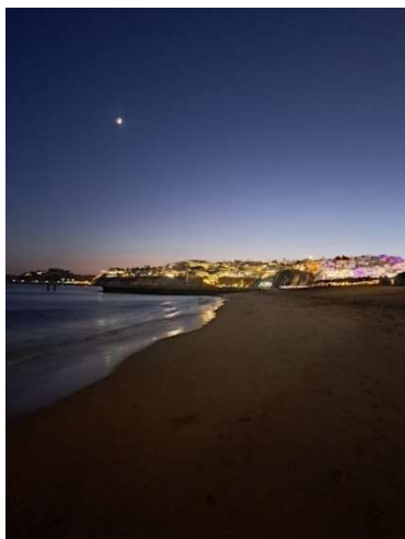
fot. 72 Praktyki studentki Fizjoterapii w Hiszpanii