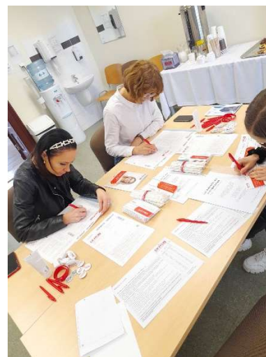
fot. 111 Akcja DKMS w murach ANS Gniezno 17-23.04.2023r.