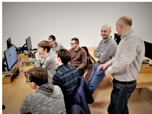
fot. 22 Szkolenie z programowania instalacji inteligentnych w standardzie LCN