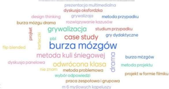
fot. 37 Warsztaty pt. „ Metody aktywne, kreatywne...