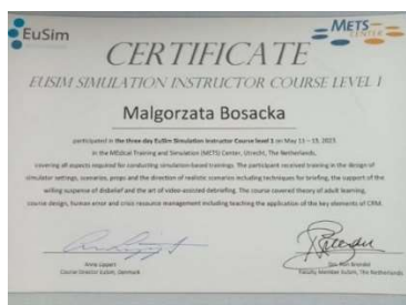
fot. 41 Certyfikat kursu instruktorskiego

Nasi wykładowcy udali się do Ośrodka Symulacji Medycznej METS w Bilthoven w Holandii, gdzie poznali wszystkie aspekty wymagane do prowadzenia szkoleń opartych na symulacji medycznej.