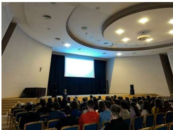
fot. 99 Spotkanie z maturzystami I LO w Gnieźnie

studiowanie na kierunkach medycznych naszej uczelni. Przybliżyły zawody fizjoterapeuty i pielęgniarki, opowiedziały o tworzeniu zespołów interdyscyplinarnych, a także o samodzielności zawodowej tych dwóch zawodów.