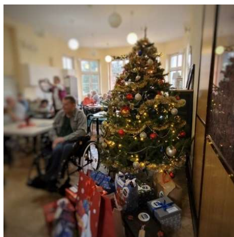
fot. 92 Akcja społeczna „Anielskie skrzydła”