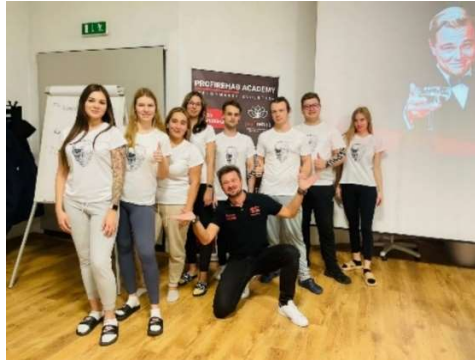
fot. 15 Szkolenie „Kompleksowa terapia powięzi”

biodrowo-piszczelowe) oraz bólu pochodzącego z układu somatycznego (mrowienia kończyn czy bóle głowy).