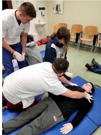
fot. 94 Wizyta w ANS młodzieży z Językowego Liceum Ogólnokształcącego Prymus w Gnieźnie