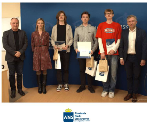
fol. 108 II. Edycja konkursu z j. angielskiego w ANS Gniezno