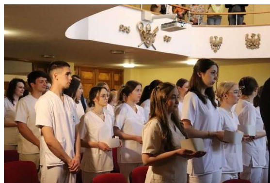
fol. 128 Uroczystość czepkowania studentów II roku pielęgniarstwa