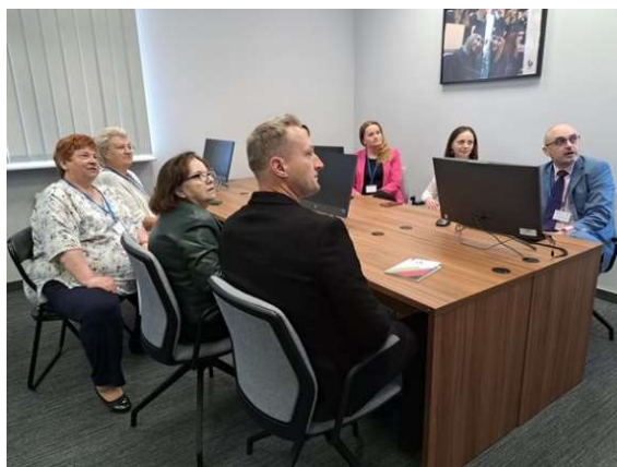
fot. 137 Spotkanie przedstawicieli bibliotek w ramach WZPUZ w Pile