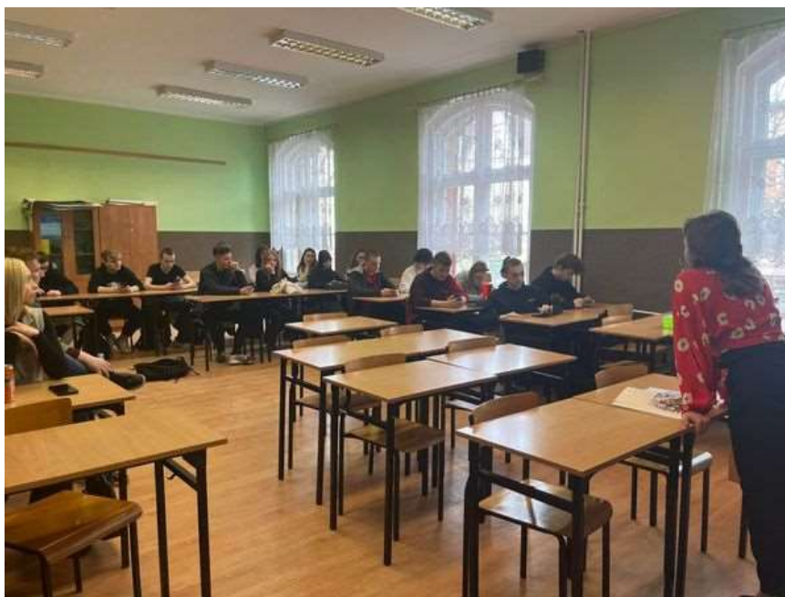
fot. 97 Warsztaty dla maturzystów w III LO w Grudziądzu

▪ Spotkanie z grudziądzkimi maturzystami i klasą patronacką to możliwość promocji kierunków studiów, które prowadzone są w ANS Gniezno. Studenci kierunku analityka bezpieczeństwa, przeprowadzili warsztaty, przeznaczone dla uczniów III Liceum Ogólnokształcące im. Jana Pawła II Grudziądz, przybliżając obszar analizy blockchain oraz kryptowalut, a także korzyści z wyjazdów zagranicznych, które realizują studenci.