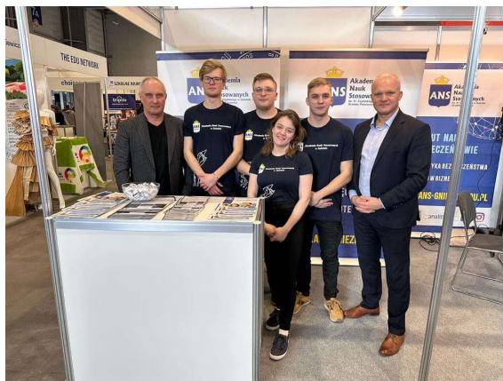
fot. 104 Studenci ANS Gniezno na Targach Edukacyjnych 2023r. w Poznaniu

Każdy maturzysta, który odwiedził stoisko ANS w Gnieźnie uzyskał wiele ciekawych informacji o uczelni – studenci mogli podzielić się swoimi wrażeniami, opowiedzieć o ciekawych przedmiotach, wykładowcach czy panującej w kampusie atmosferze.