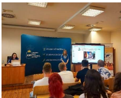
foto. 63 Wizyta wykładowców z Ukrainy 29.05.2023r.- 04.06.2023r.