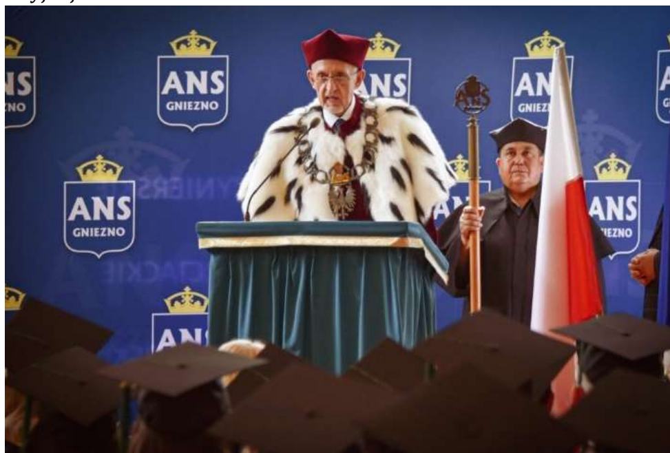
fot. 130 Uroczystość Absolutorium studentów pielęgniarstwa i fizjoterapii

To jeden z takich dni, które na bardzo długo pozostają w pamięci. Absolwentom towarzyszyli zaproszeni goście, wykładowcy, opiekunowie oraz bliscy, którzy zapełnili malowniczą aulę Centrum Edukacyjno-Formacyjnego Archidiecezji Gnieźnieńskiej przy ul. Seminaryjnej w Gnieźnie.