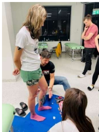
fot. 16 Szkolenie z zakresu kinetic running