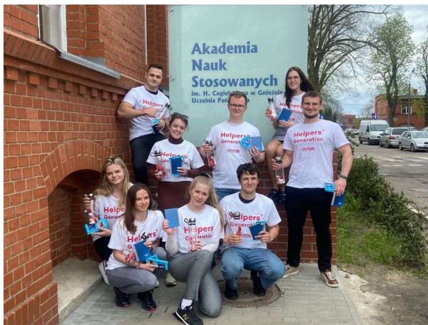
fot. 109 Akcja DKMS w murach ANS Gniezno 17-23.04.2023r.

nowotworami krwi poprzez edukację oraz inicjowanie akcji rejestracji. W ramach poprzednich inicjatyw na uczelniach w Polsce zarejestrowano niemal 150 000 potencjalnych Dawców, spośród których już ponad 1297 osób (styczeń 2023) podarowały potrzebującym szansę na życie.