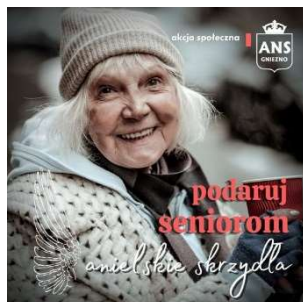
fot. 90 Akcja społeczna „Anielskie skrzydła”

Już po raz trzeci udało się otoczyć opieką podopiecznych z gnieźnieńskiego Domu Pomocy Społecznej. To wspólna inicjatywa całej społeczności Uczelni oraz ludzi dobrej woli. Akcja społeczna „Anielskie Skrzydła” organizowana przed Świątami Bożego Narodzenia polega na otoczeniu seniorów atencją, ciepłym słowem i drobnym upominkiem. Jak co roku nie zabrakło radości, ciepłych słów i wzruszeń.