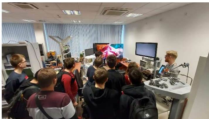
fot. 20 Wyjazd studyjny do PCSS