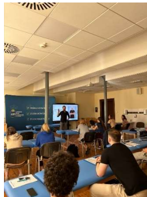
fot. 39 Warsztaty teoretyczno-praktyczne z FRSC