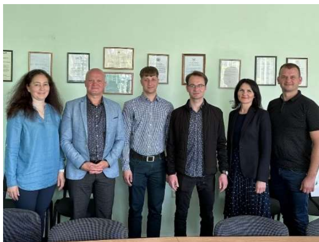
fot. 81 Wizyta Prorektora ANS Gniezno w uczelni partnerskiej Utenos Kolegija na Litwie