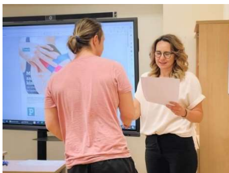
fot. 54 Zebranie członków Koła Naukowego Studentów Fizjoterapii 13.06.2023