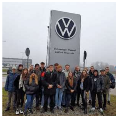
fot. 30 Wizyta w fabryce Volkswagena 6.12.2022r.